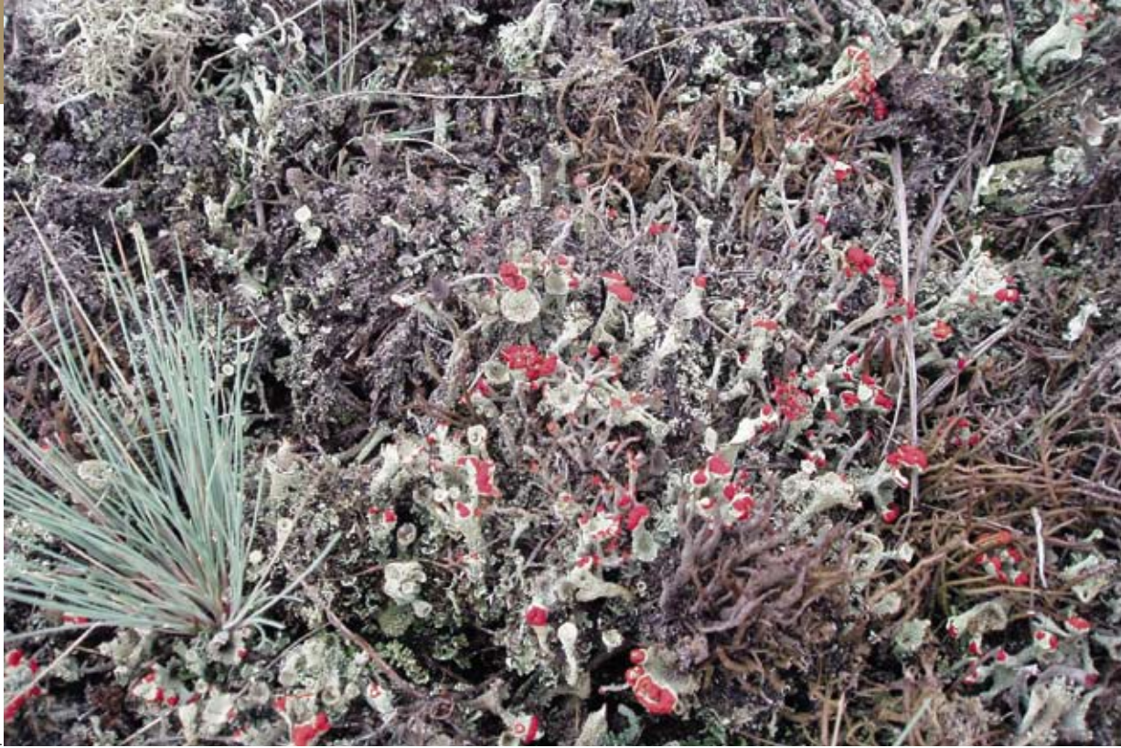
Korstmossenrijke buntgrassteppe op het Deelensche zand

De kans op falen neemt echter toe naarmate de bodem meer organische stof bevat. Bij sterk organische bodems slaat grijs kronkelsteeltje direct toe, met daarna mogelijk ook meer opslag van vliegdennen. Om in sterk vergraste kapvlakten weer vroegere successiestadia met een hogere biodiversiteit terug te krijgen, heeft kleinschalig plaggen de voorkeur. Dit is de enige manier om korstmossen uit zandige pionierstadia zoals stuifzandkorrelloof terug te krijgen. Bij dit kleinschalige patroonbeheer worden de karakteristieke faunasoorten nauwelijks bedreigd en blijven op korte afstand voorkomen.