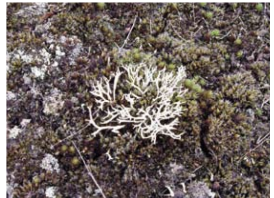
Nieuwe vestiging van het korstmos ezelspootje op de moslaag

centimeter met een oude B-horizont op de overgang met het onderliggende dekzand. Deze werkte isolerend zodat een meer extreem microklimaat ontstond. In dit milieu groeiden vooral zandstruisgras en het pioniermos ruig haarmos. In 2008 bedekten zandstruisgras en/of bochtige smele in de omgeving van de veldjes 70% van het bodemoppervlak met een gemiddelde pluimhoogte van 60 centimeter. De bodemontwikkeling bleek evenredig te zijn met het dichter worden van de plantengroei van vaatplanten en mossen. Als het dekzand plaatselijk wat vochtiger was en veel humus en wortels bevatte, dan groeiden er zandstruisgras en veel grijs kronkelsteeltje (veldje III en IV).