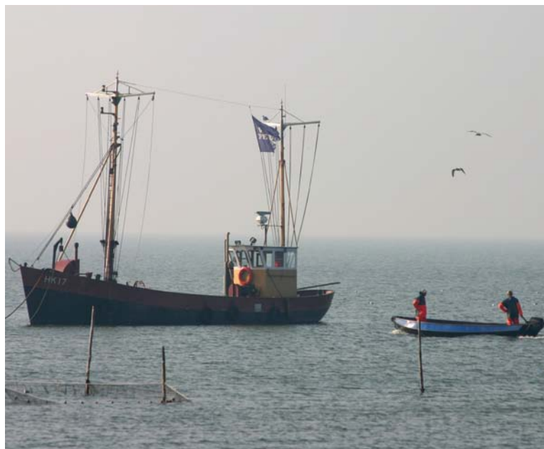
Speerpunt van een VBC is het streven naar een duurzame visserij

Het gebrek aan samenwerking wordt door de geïnterviewde VBC-leden als een belangrijke faalfactor voor het functioneren van VBC's gezien. Er zijn diverse redenen aan te wijzen waarom de samenwerking binnen VBC's te wensen overlaat en het produceren van concrete zaken als visplannen achterblijven bij de verwachting.