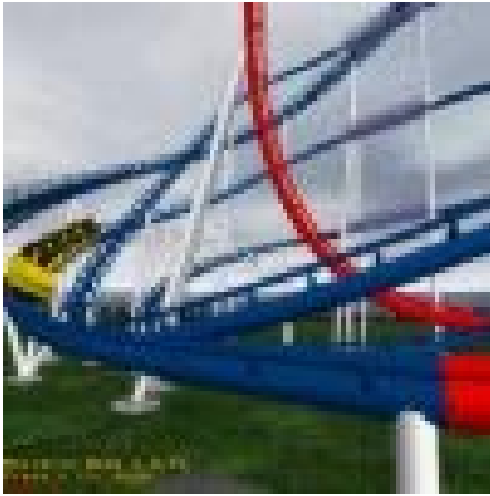
Rollercoaster is een thema dat in de NVK 2002 wordt uitgewerkt

stand van zaken in natuur en landschap wordt beschreven in Ecostate . De verkenning van maatschappelijke trends in relatie tot natuur en landschap ( Ecotion ) wordt uitgewerkt in drie thema's: Robocow , landbouw in beweging, Syncity , het nieuwe wonen en Rollercoaster , (bij)sturen in Europa. In het deel Ecoregion staan gebieden centraal die vanuit het Rijksbeleid extra aandacht verdienen.