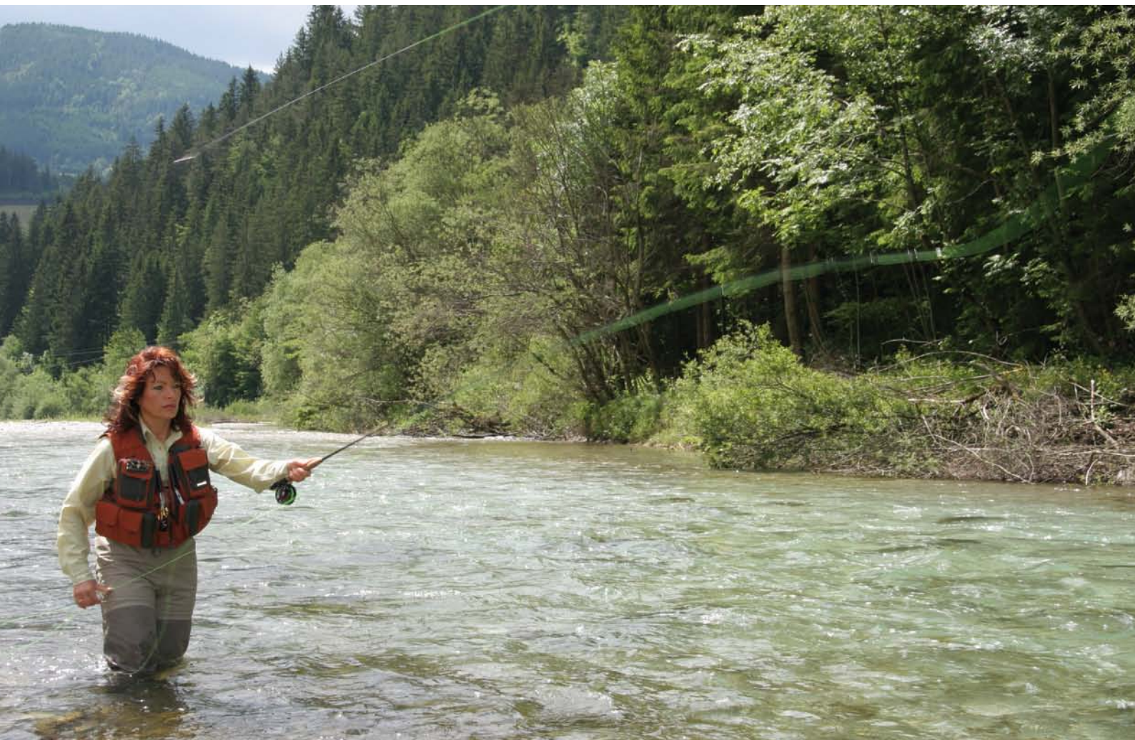
Het vliegvissen kent opvallend veel vrouwelijke deelnemers.

Het vliegvissen op ruisvoorn vindt traditiegetrouw vooral in de veenweidepolders van het Groene Hart plaats. Helaas gaan deze polders zienderogen achteruit. De oorzaak ligt vooral bij landinrichtingen, herinrichtingen van polders en onderhoud in het kader van natuurbeheer. Vele zijsloten en wateraftakkingen zijn voor de ruisvoorn onbereikbaar geworden door het aanbrengen van bijvoorbeeld peilscheidingen – om hoogwatergebieden in stand te houden rond boerderijen – en het aanbrengen van dammetjes zonder rekening te houden met het leefklimaat van de vis. Hierdoor worden de paaigebieden onbereikbaar voor de ruisvoorn en lijkt deze vis langzaam te verdwijnen uit het polderlandschap. Vliegvissers zijn meer dan gemiddeld actief in visstandbeheerscommissies waar zij zich onder meer inzetten voor het herstel van veenweidepolders. V