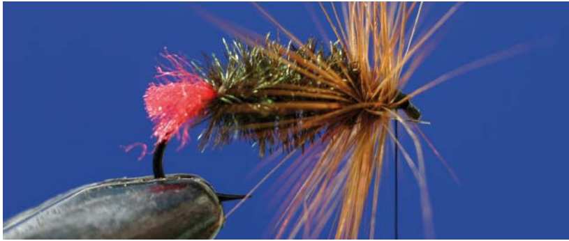
De meeste vliegvissers maken hun vliegen zelf.

25 meter bedraagt, dienen vliegvissers de vis dicht te naderen. Een waadpak of minimaal lieslaarzen behoren dan ook tot de standaard uitrusting.