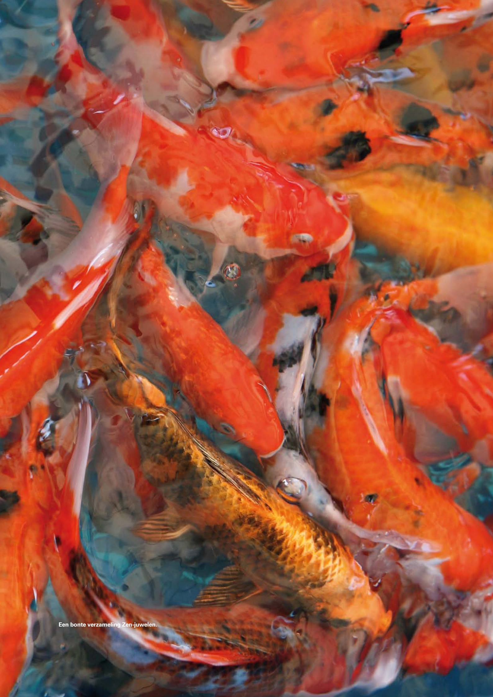
Een bonte verzameling Zen-juwelen.