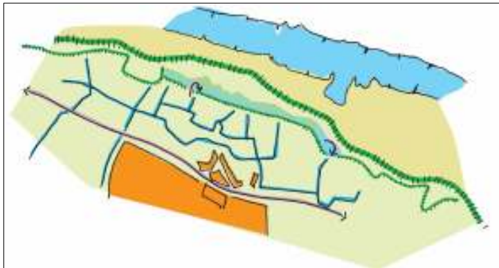
Voorbeeld van accentuering van een voormalige kwelkade.

In het grootste deel van het oostelijk rivierengebied kan de herkenbaarheid van de cascaden vergroot worden door het peilverschil, waar ene cascade in andere overgaat, te benutten door: