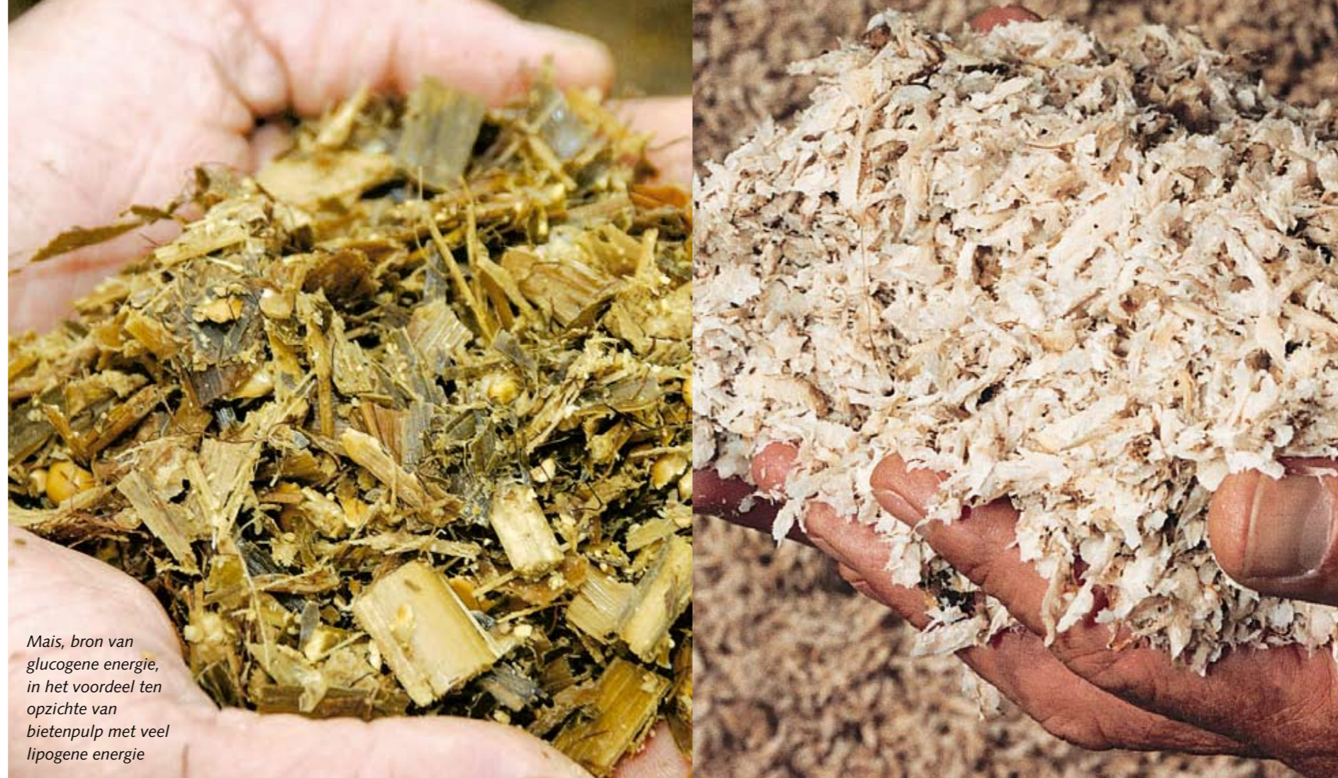
Mais, bron van glucogene energie, in het voordeel ten opzichte van bietenpulp met veel lipogene energie

M elkvee is decennialang geselecteerd op een hoge melkproductie, terwijl de koe aan het begin van de lactatie niet in staat is voldoende energie voor deze melkproductie op te nemen via het rantsoen. Dit resulteert in een negatieve energiebalans. De negatieve energiebalans zorgt voor stofwisselings- en vruchtbaarheidsstoornissen, zoals slepende melkziekte en leververvetting, en lagere bevruchtingspercentages. Het verhogen van de energiedichtheid van het rantsoen is een gebruikelijke benadering om de energieopname aan het begin van de lactatie te verhogen. Een alternatieve benadering om de energiebalans in de vroege lactatie te verbeteren is het verlagen van de hoeveelheid energie die het lichaam met de melk verlaat. In een promotieonderzoek aan Wageningen Universiteit is gekeken of een toename van de hoeveelheid glucogene ten opzichte van lipogene nutriënten in het rantsoen de hoeveelheid vet in de melk verlaagt. Een lagere melkvetproductie resulteert in minder energie in de melk.