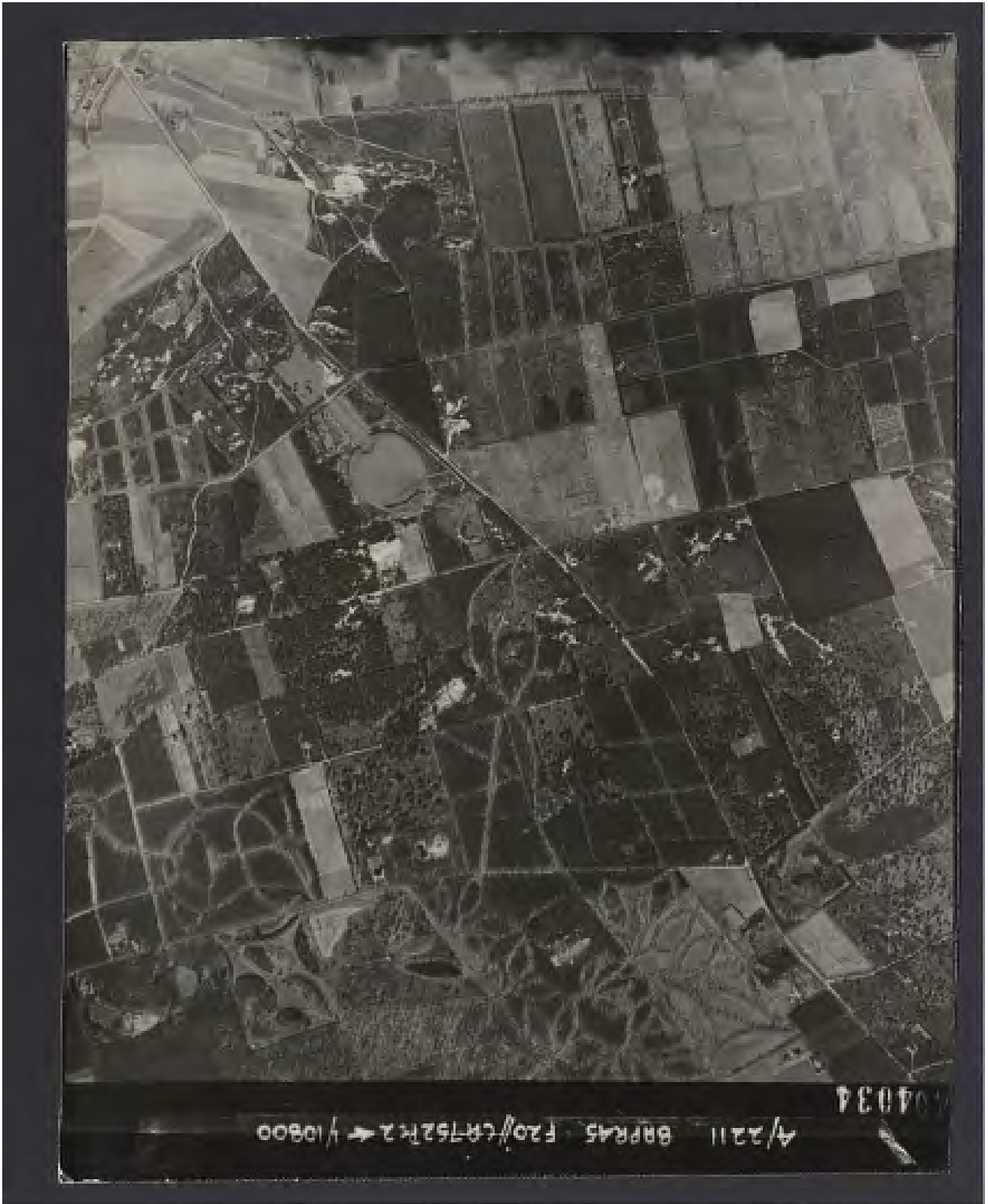
Royal Air Force (Medmenham) [Nederland : collectie luchtfoto's van de Geallieerden] FORUM - SPEC.COLL. - RAF244-8-4034 (8 april 1945) (zie p. 24)