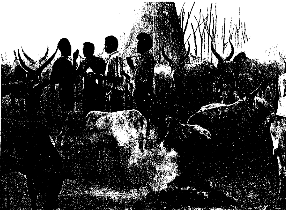
Studenten in gesprek met een Bari-veeboer in zijn 'cattle-camp' tussen rokende mest. Deze foto werd gemaakt tijdens de workshops 'curriculum for village needs'.

Tot slot van dit artikel volgt hier nog een korte persoonlijke evaluatie van twee jaar werken in Juba. Door me niet op te stellen als de al-wetende buitenstaander heb ik