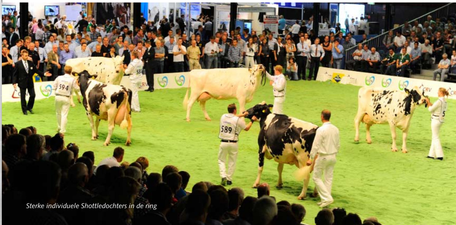
Sterke individuele Shottledochters in de ring