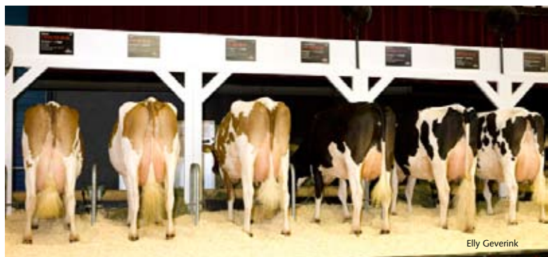
Sterke achteruiers van de stijlvolle dochters van Mr. Burns