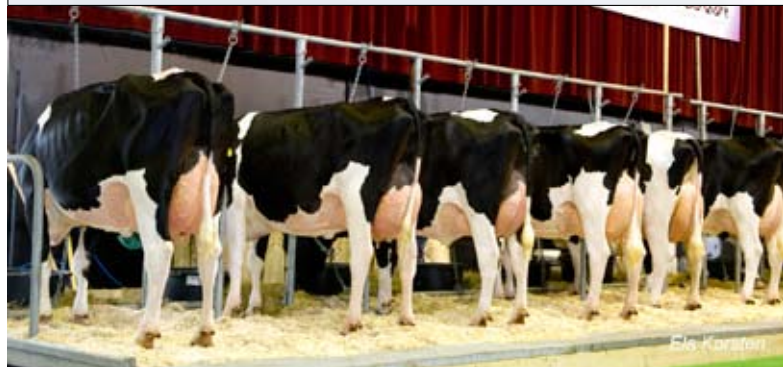
Stol Jocdochters tonen brede melkskeletten en productieve uiers

Ook Shottle behoeft weinig introductie. De groep van de Mtotozoon was minder uniform dan die van Goldwyn , maar ook hier zorgden keuringsvedettes voor een fraaie invulling met veel stijl in het skelet, een harde bovenbouw, maar met wel een grovere botkwaliteit in skelet en het beenwerk. De ophanging van de uiers van de oudere koeien kon het niveau van de jongere dieren niet helemaal vasthouden. |