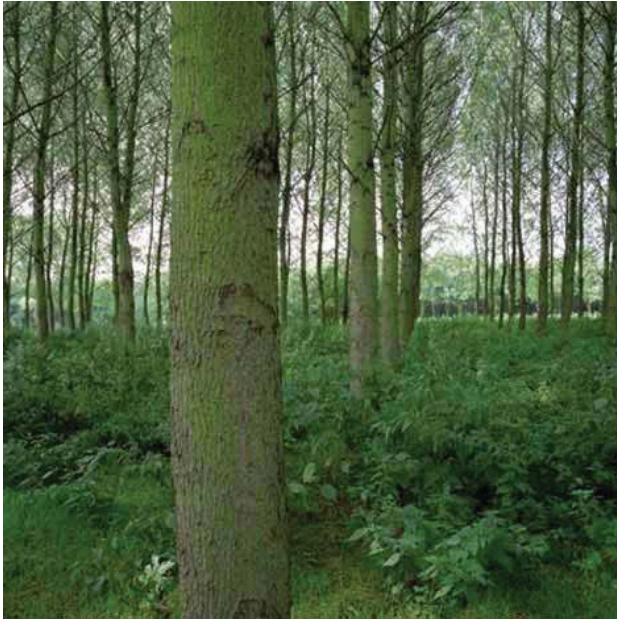
Figuur 5.2 Het Purmerbos

De oorzaak was de saaiheid was ondermeer het ontbreken van recreatieve voorzieningen. Maar er zijn ook positieve geluiden, zoals een inwoner uit Purmerend op internet zegt: “Ik heb het bos zien aanplanten en heb er vanaf het begin tussen de sprietten in de polder gelopen. Inmiddels een flink aantal jaren later wordt het bos steeds meer een echt bos. Natuurlijk moet de natuur zijn gang nog verder gaan. Je hoort de vogels, je ziet de buizerd en soms een kiekendief, je ruikt het bos soms al. De takken raken elkaar, de grond eronder wordt al zwart, de bladeren blijven liggen en rotten weg: steeds meer een echt bos. En voor iedereen die het nog niets vindt: loop de gele wandelroute en je waant je in een echt bos. Trek wel een paar waterdichte schoenen of laarzen aan, maar het is echt genieten”.