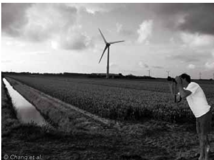
Een mogelijke combinatie van toerisme en duurzame energie op Goeree-Overflakkee

Al eerder is, bijvoorbeeld in AGORA 2007-5 'Energie', betoogd dat ruimtelijke ordening en ontwerp energietransitie kan ondersteunen en sturen. Recent onderzoek hiernaar bracht nieuwe strategieën en aanpakken naar voren, zoals de besproken vijfstappenbenadering. Binnen het bredere kader van duurzame energielandschappen is het vooral belangrijk dat de criteria rond concurrerend landgebruik, biodiversiteit en landschappelijke kwaliteit vanaf een vroeg stadium meegenomen worden. Landschappen waarin slechts hernieuwbare energiebronnen een plek hebben gekregen, zoals veel van de huidige windturbineparken, zijn nog geen duurzaam energielandschappen, alleen al omdat ze als visueel hinderlijk ervaren worden. De interesse voor de zichtbare consequenties van energietransitie en de zorg voor behoud van landschappelijke kwaliteit zijn, met uitzondering van het debat rond windenergie, vrij recent. Uit de voorbeelden volgt dat energietransitie niet alleen een doel op zich is, maar dat het door de ruimtelijke ordening zowel als middel en als kans wordt opgevat voor het verhogen van landschappelijke kwaliteit en daarmee duurzaamheid. Hoewel er is verzaakt om een goede