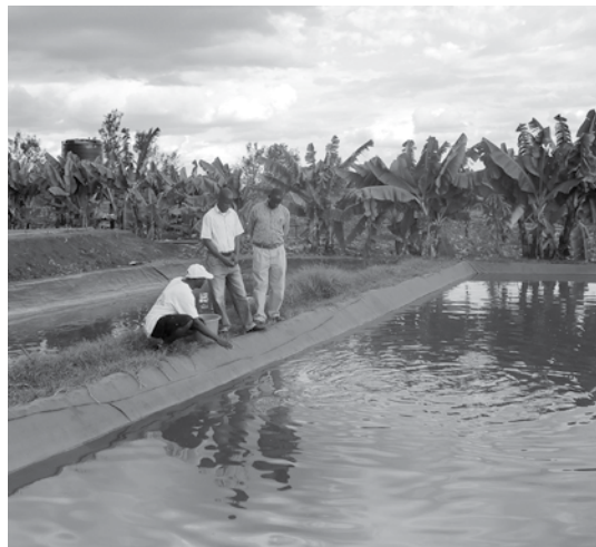
Tilapiavijvers van commerciële kweker

Voor het ontwikkelen van commerciële, intensieve viskweek zijn vooral voer en water van belang. Visvoer van goede kwaliteit is niet beschikbaar in Kenia. Daarom zal onderzocht moeten worden welke voeders (samenstelling, kwaliteit en productieproces) lokaal gemaakt kunnen worden waarbij de bulk van de ingrediënten ook lokaal beschikbaar zal moeten zijn. Als tweede factor is water van de juiste temperatuur, kwaliteit en volume van belang. Beide factoren tezamen bepalen welk type productiesysteem met bijbehorende kostprijs van vis, het meest kansrijk is voor Kenia. Dit kan variëren van intensief doorstroomde vijvers tot aangepaste RAS systemen. Hiervoor is meer onderzoek nodig. Maar ook de Keniaanse overheid zal haar beleid moeten aanpassen. Zo worden momenteel subsidies verstrekt voor het graven van visvijvers, de aanschaf pootvis en voer (zie hierover ook het artikel van Jeff Hino elders in dit blad). Deze subsidies werken marktverstoring. Ook zal de overheid de huidige heffingen op