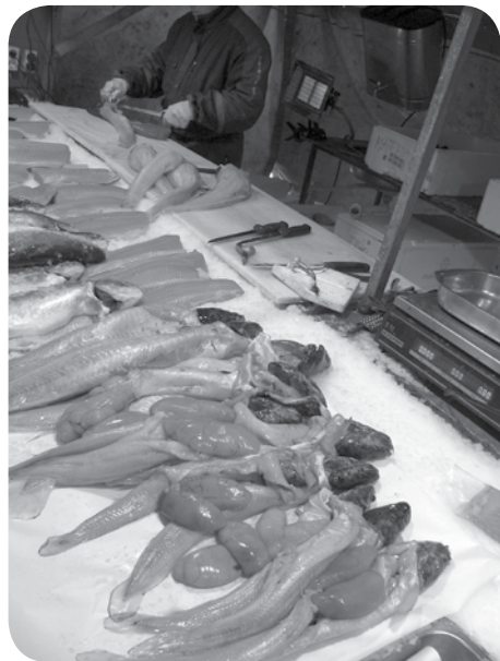
Foto 1. Zoetwaterkabeljauw (kwabaal) op een Finse markt. Ook de kuit wordt als delicatessen verkocht.

In deze regio's wordt deze vis wegens zijn smakelijke, vaste en witte filet als een uitstekende voedselvis beschouwd en de lever wordt zelfs aangezien als een delicatessen. In Finland eet men zelfs de eieren! In een recente smaaktest voor Aqua-Vlan, uitgevoerd door het PCG met gewone consumenten, werd de filet eveneens als zeer smakelijk ervaren en behaalde deze soort topscores op alle criteria. Omwille van de hoge kwaliteit van de filet werd deze vis opgenomen in het Aqua-Vlan project.