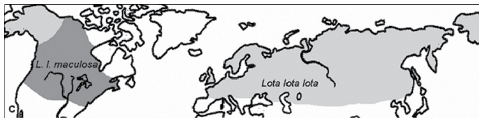
Figuur 1: Verspreidingsgebied (Figuur: INBO)

door het Europees Fonds voor Regionale Ontwikkeling, het Vlaamse Gewest en de respectievelijke provincies en instituten. (Zie ook de nummers 2, 3 en 5 (2010) van “Aquacultuur”). Binnen het kader van dit project worden enkele potentiële vissoorten voor aquacultuur in de grensregio naar voor geschoven: zoetwaterkabeljauw, snoekbaars, omegabaars en geelstaart. De KAHO Sint-Lieven onderzoekt momenteel de teelttechnische vereisten van de in de