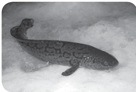
Zoetwaterkabeljauw gevangen door sportvisser in Zweden

De kwabaal is in Nederland zeldzaam maar staat niet in de lijst van beschermde vissoorten. De soort staat ook niet op de lijst van voor consumptie te houden vissoorten, wat dus betekent dat men voor de teelt eerst een ontheffing moet aanvragen bij het Ministerie van E, L & I.