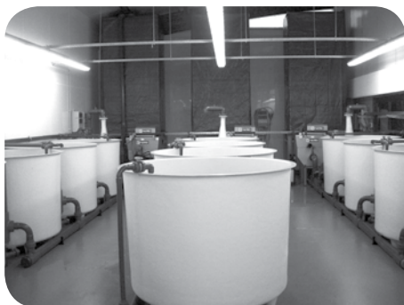
Foto 5. Het praktijkgerichte Aqua-ERF onderzoekssysteem