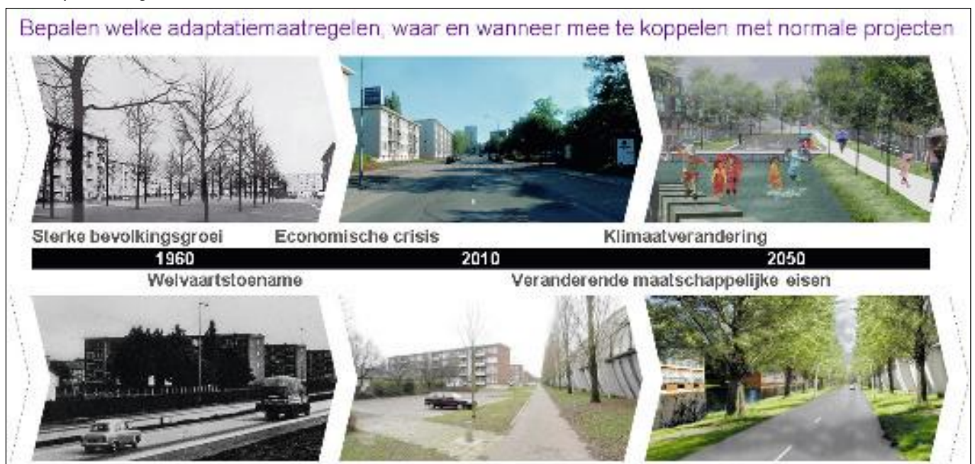
Afb. 2: Adaptatiemaatregelen van 1960 tot 2050.

In de jaren '60 heeft de toenmalige Delta-commissie de risicobenadering in de wereld van waterveiligheid geïntroduceerd. De kans op een dijkdoorbraak en de gevolgen ervan bepalen gezamenlijk het overstromingsrisico. In de afgelopen decennia is de risicobenadering in diverse studies verder ontwikkeld tot een praktisch toepasbaar instrument. Het is dan ook niet verrassend