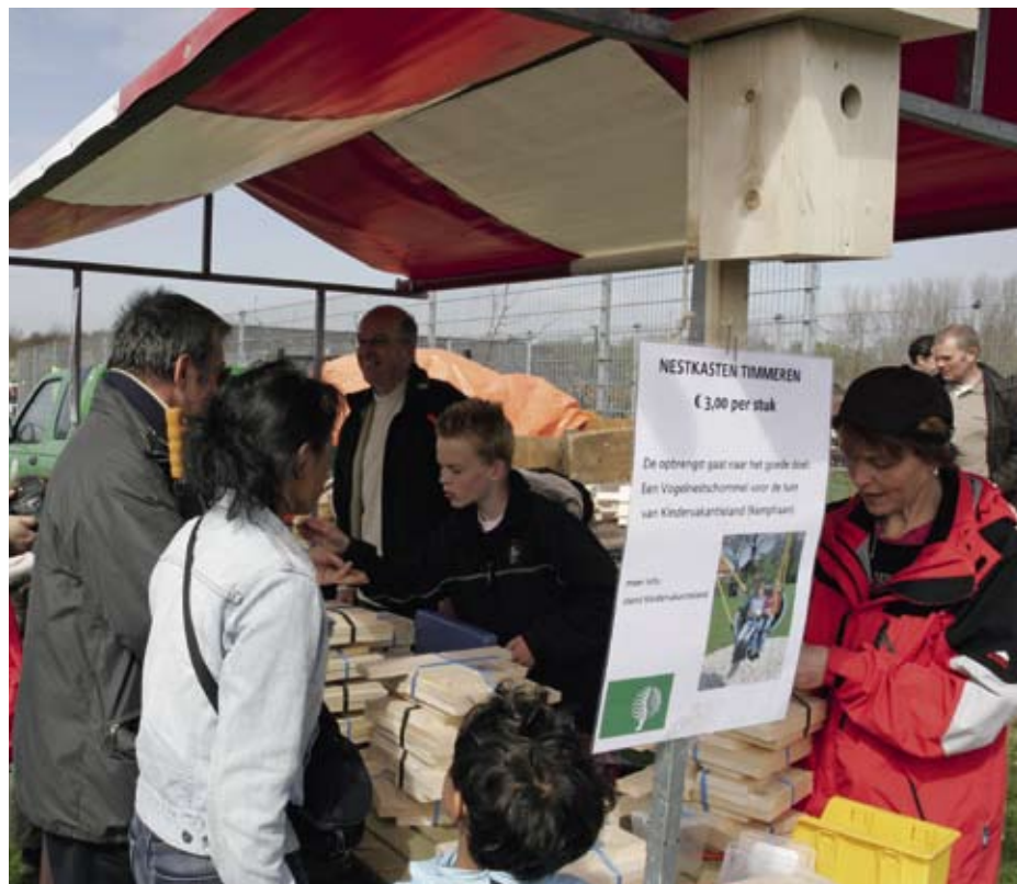
Evenementen zijn voor terreinbeheersers een mogelijkheid om geld te genereren

Hierbij moet onmiddellijk opgemerkt worden dat de mate waarin provincies beschikken over eigen middelen sterk verschilt. Zo hebben sommige provincies extra financiële armslag, met name uit dividenden of verkoop van energiebedrijven. Gelderland en Overijssel bijvoorbeeld zijn in dit opzicht beter bedeeld dan Drenthe, Zuid-Holland en Flevoland. Een indruk van deze verschillen in 'rijkdom' van de provincies krijgen we door te kijken naar de manier waarop het Rijk bij de uitkeringen uit het Provinciefonds weer enigszins corrigeert voor dit eigen vermogen. Figuur 1 geeft op deze manier een indicatie van de verschillen in vermogen van provincies.