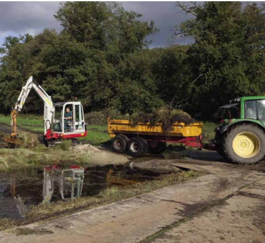
“Maximale inzet op beheer, minimaal op verwerving”.