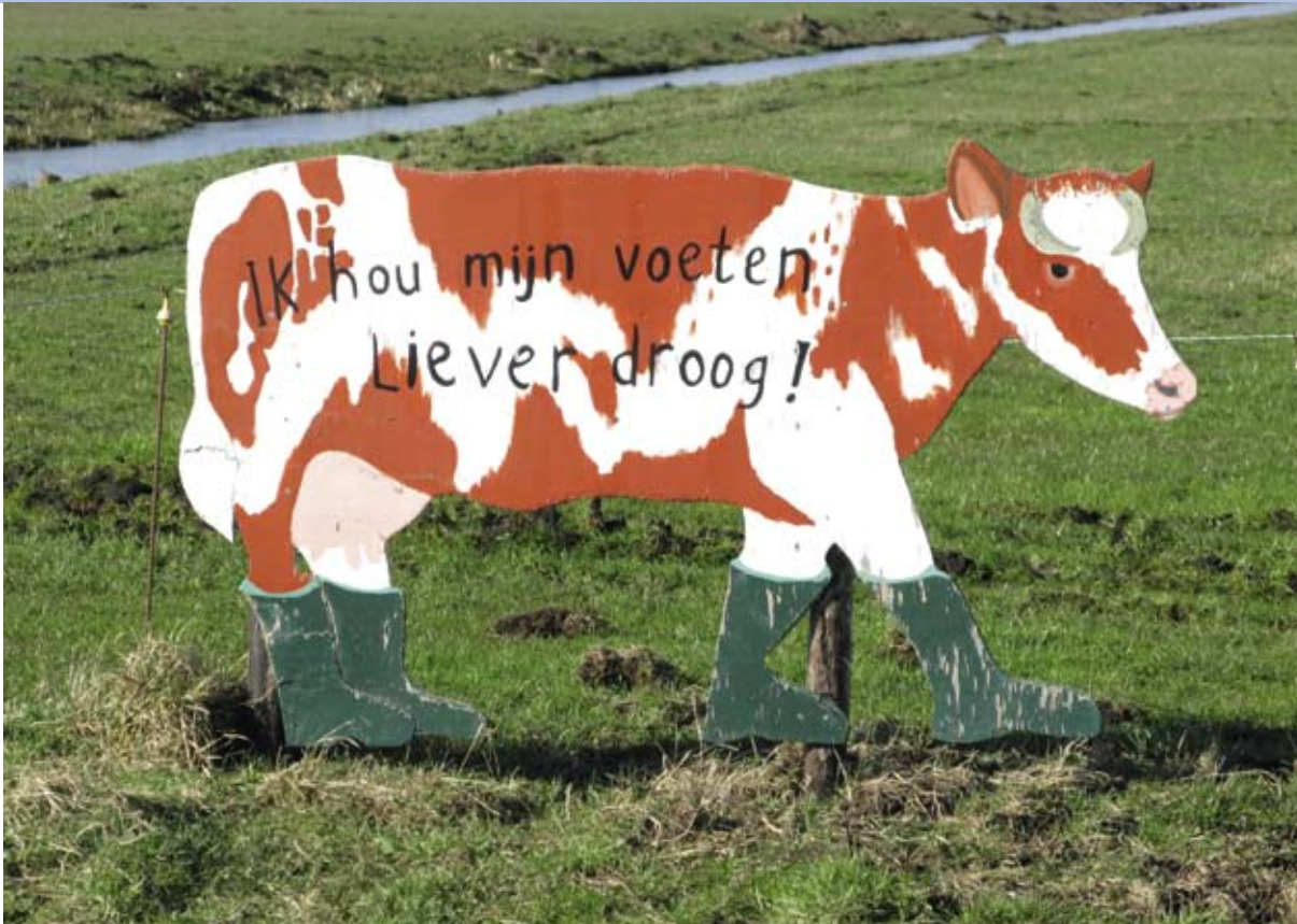
Geen natuur meer op landbouwgrond.