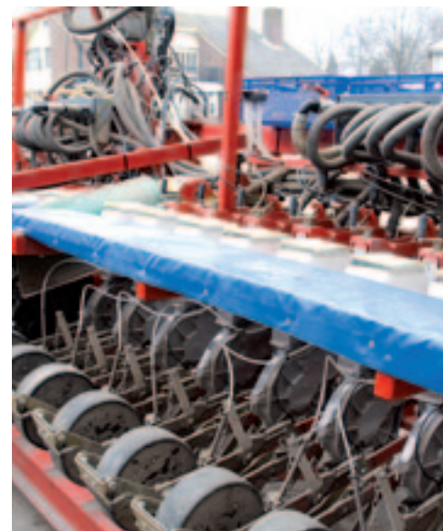
▲ Gebruiker Ad Testers maakte het frame uitschuifbaar door middel van twee cilinders. Ook de markeur schuift mee. Voor spuitsporen schuift hij 40 cm uit.