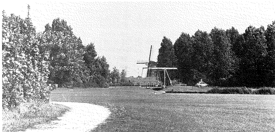
De 30.000 à 35.000 ha nieuw bos met blijvend karakter worden in sterke mate op een combinatie van openluchtrecreatie en houtproductie gericht (Populierenbossen bij de Rottemeren).

subsidie ontvangt die door de overheid wordt verstrekt voor de (verplichte!) herbebossing. Nu is al verscheidene jaren gebleken dat de fondsen voor die subsidie, die 80% van de herbebossingskosten dekt, ontoereikend zijn; ook dit jaar moest nota bene al in de eerste maand het indienen van aanvragen voor deze subsidie worden stopgezet. Dat scheidt al geen vertrouwen. Als men dan bovendien in het Meerjarenplan ziet dat de voor de komende jaren geraamde gelden absoluut onvoldoende zijn om die oppervlakte te kunnen verjongen die gekapt moet worden om aan het produktiedoel te beantwoorden, dan vraagt men zich toch wel af met welk beleid de overheid bezig is. Aan de ene kant prachtige produktiedoelen, aan de andere kant onvoldoende middelen. Welnu, daarop heeft de Tweede Kamer met nadruk kritiek geuit vooral bij monde van De Leeuw. Die stelde het volgende: „De houtproductie is in het Meerjarenplan, gelet op het beschikbare budget, te optimistisch geraamd. Het is hier van drieën één. Of de Minister acht de voorgenomen uitbreiding van de houtproductie zo belangrijk dat hij in de komende jaren hiervoor financiële ruimte creëert, of hij zal de prioriteitstelling moeten herzien en het produktiedoel minder ambitieus moeten maken, of hij faseert de realisatie van het Meerjarenplan”.