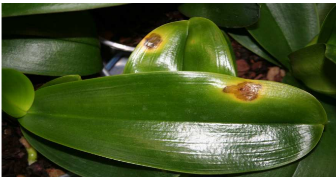
Figuur 1. Aantasting met Pseudomonas cattleyae .

In de opkweekfase van Phalaenopsis treden infecties met de bacterie Acidovorax avenae subsp. cattleyae . In de praktijk staat deze bacterie veelal beter bekend onder een oude naam: Pseudomonas cattleyae . Bij een aantasting ontstaan in korte tijd zwarte ingezonken lesies op het blad, waarom heen een gele rand zichtbaar wordt (Fig. 1). De totale uitval kan oplopen tot wel 20% van de planten.