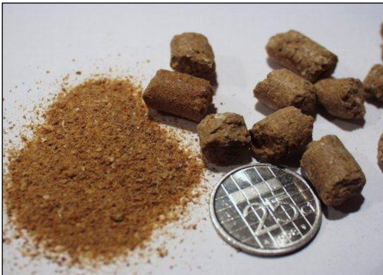
Figuur 1 Verwerkt dierlijk eiwit

In de Westerse maatschappij wordt een groot deel van het geslachte dier niet gebruikt voor menselijke consumptie. Dit slachtmateriaal (bestaande uit categorie 3 1 -materiaal), dat onder andere bestaat uit vet, vlees, organen, botten, bloed en veren, wordt van de slachterij naar een verwerkingsbedrijf gebracht en daar onder een strikt protocol verwerkt tot verwerkt dierlijk eiwit. Verwerkt dierlijk eiwit is een fijnkorrelig product (Figuur 1), afkomstig van gespecialiseerde producenten. Verwerkt dierlijk eiwit is een belangrijke bron van eiwit, mineralen en vitaminen. Verwerkt dierlijk eiwit heeft daarnaast een hogere energiewaarde dan eiwitleverende plantaardige grondstoffen, zoals sojaschroot. Bij de voedersamenstelling wordt gelet op de samenstelling en voedingswaarde van de grondstoffen en op de kostprijs.