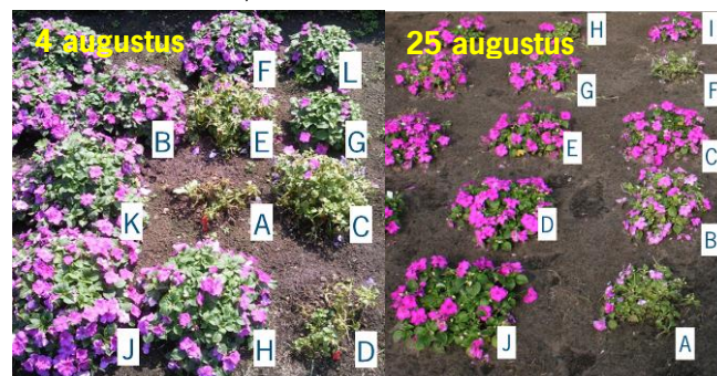
Figuur 2. Foto impressie van Impatiens planten in het veld in Emsbüren (Duitsland) bij twee verschillende plantdata. Foto links: planting in de vroege zomer (26 mei) met daarin de bloeiende planten die behandeld zijn met Ridomil Gold of combinaties daarvan. Foto rechts: planting in de late zomer (5 juli) met daarin de bloeiende planten die behandeld zijn met kaliumfosfiet of Middel X (Everris).