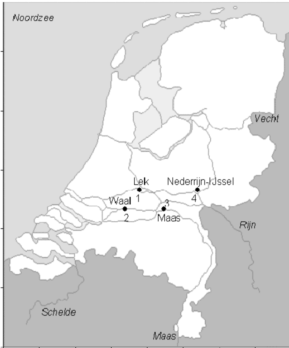
Figuur 2. Overzicht van de locaties van de zalmsteken die worden geregistreerd.

plaatsgevonden. De tweede periode is net afgesloten (oktober tot eind november). Deze gegevens en logboeken moeten grotendeels nog verzameld worden van de desbetreffende beroepsvissers. Invoer van alle gegevens zal in december 2011- februari 2012 plaatsvinden.