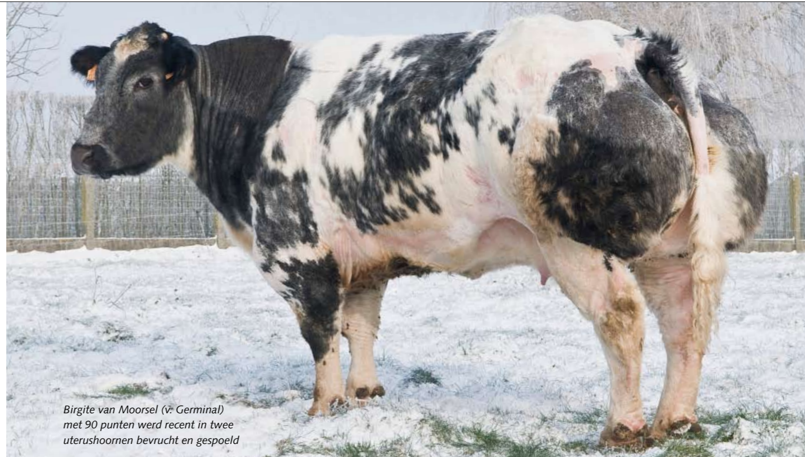
Birgite van Moorsel (v. Germinal) met 90 punten werd recent in twee uterusuhoornen bevrucht en gespoeld

overhield. Taibo ten Doorn was de tweede aankoop. Deze Visconti du Tilleuldochter van 89 punten, die bij haar eigenaar klaarstond om afgemest te worden en die provinciaal kampioene was geweest te Sint-Lievens-Houtem, is een schot in de roos. 'Wij hebben van de koe nog tweehonderd embryo's geoogst. Ze is zelfs nog tien jaar geworden.' De sessie met ki-stier Germinal resulteerde onder meer in eedergenoemde Birgite van Moorsel, die voor exterieur werd gepunt met negentig punten. De paring van Taibo met ki-stier Dandy du Tilleul resulteerde in het stiertje Vanobles van Moorsel. De ki-centra toonden veel belangstelling in Vanobles, die veel 1a-plaatsen op de keuringen behaalde. De stier werd finaal door een Henegouwse fokker aangekocht. 'Vanobles werd met het oog op deelname aan de nationale te Libramont door zijn nieuwe eigenaar echter kapotgevoederd', zucht Frans Van Der Biest. 'Echt zonde.' Een andere stammoeder die de Oost-Vlaming aankocht, is Gardienne de Fooz, die in de moederlijn terugvoert op Agate. 'Ik kocht Gardienne aan als drachtige vaars nadat ze een derde plaats had behaald op de keuring te Hannut. De afspraak was evenwel dat het kalf voor de fokker bleef. Het verhaal is dat het kalf Impatiente de Fooz heet, kampioene te Libramont in 2011.' Uit Gardienne (89