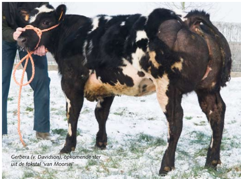
Gerbera (v. Davidson), opkomende ster uit de fokstal 'van Moorsel'