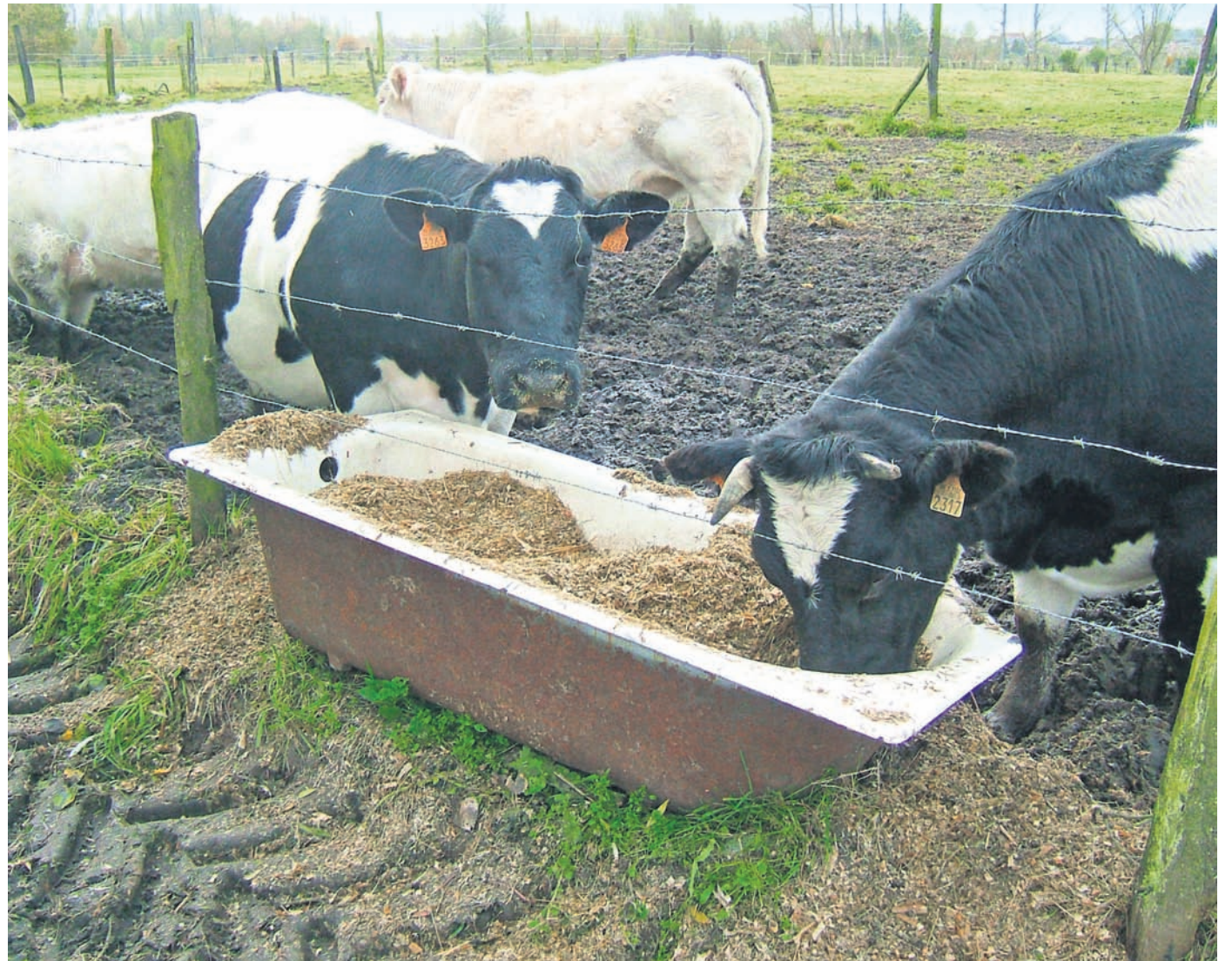
'Kloppen die verhalen wel, over de milieunadelige conversie bij koeien van 10 kilo graan tot 1 kilo rundvlees?'

Meat the Truth geeft een overzicht van de argumenten van de tegenstanders van vlees eten. Deze argumenten zijn inmiddels behoorlijk bekend: naast de uitstoot van broeikasgassen door winden en boeren van koeien en bij de verbouw van graan en soja en het transport daarvan,