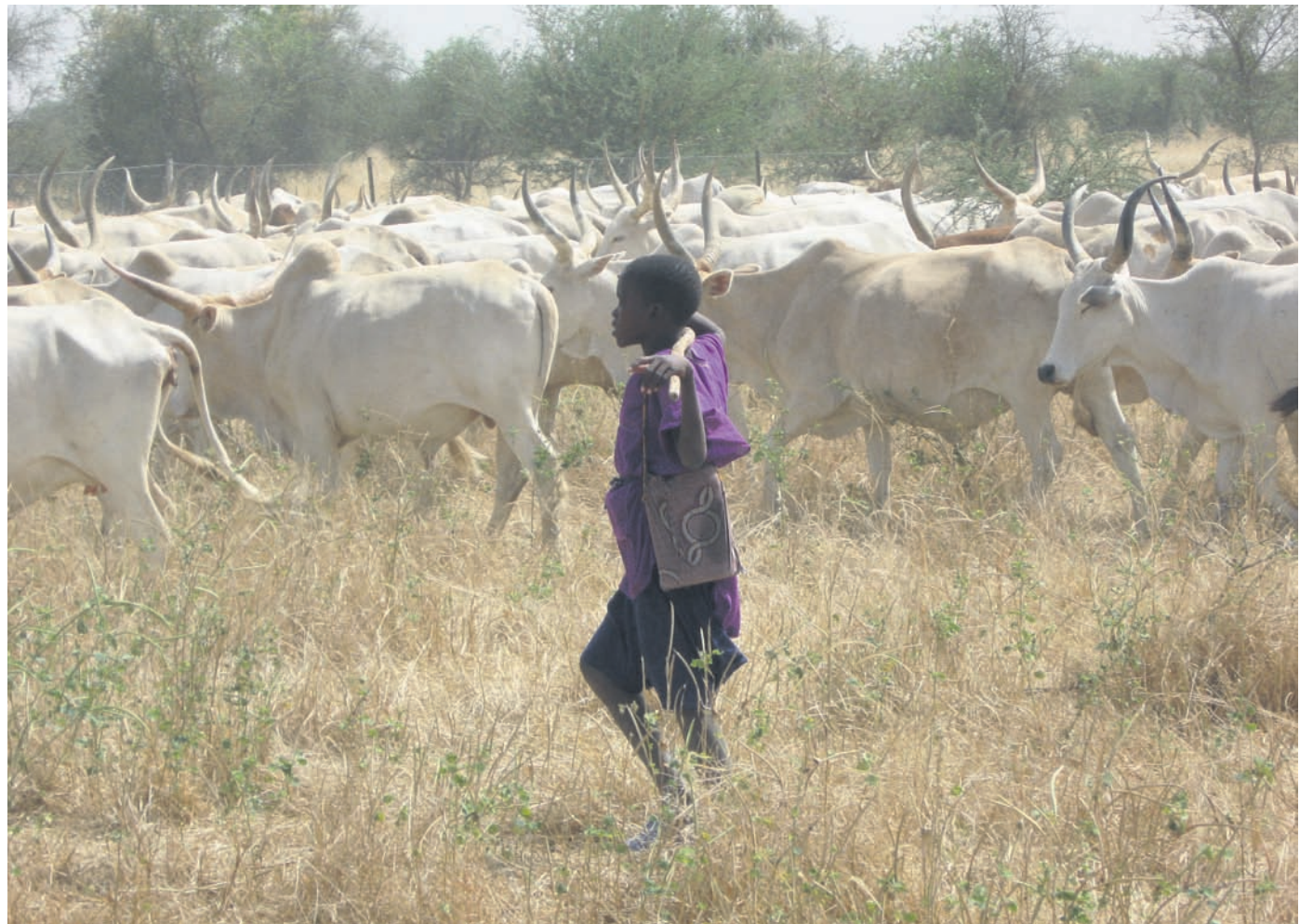
Waarom lopen dieren niet meer gewoon naar de plek waar we ze willen hebben?

Mijn evaluatie van het boek kan niet heel positief zijn; het bevat enkele goede hoofdstukken, maar er is geen enkel redactiewerk gedaan. In bijna alle hoofdstukken wordt het FAO-rapport samengevat, er is door het boek heen veel overlap en er worden veel cijfers gepresenteerd zonder de opbouw ervan te verklaren. Soms spreken de cijfers elkaar zelfs tegen, zoals die over de hoeveelheden