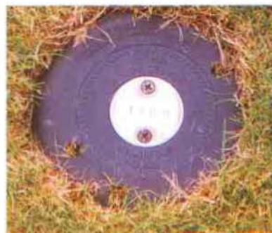
Op elke beregeningsput is de afstand naar de green vermeld.

Bij zijn voorlaatste werkgever Zeewolde, is