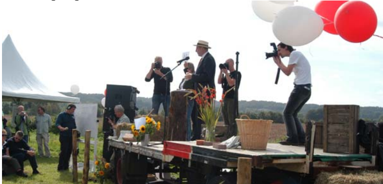
...een boerenkar voor de veilingmeester...