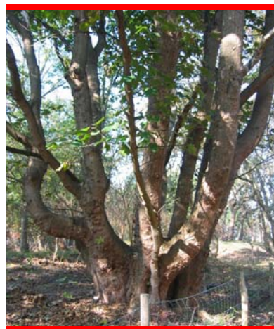
groen in de omgeving van Den Haag

In de onlangs uitgekomen Natuurbalans 2007 blijkt een tekort aan recreatief groen. Minister Verburg laat momenteel een tussenevaluatie uitvoeren die duidelijk moet maken of de doelen van Recreatie om de Stad met de huidige stand van de uitvoering en het verwachte tempo in de komende jaren wel haalbaar zijn. Daarnaast moet de evaluatie de oorzaken van het lage tempo boven water brengen. De uitkomsten en aanbevelingen worden verwerkt in de update van de ILG-bestuursovereenkomsten.