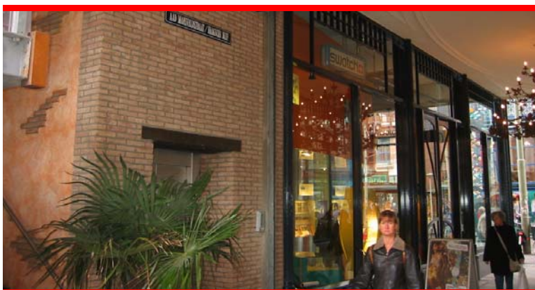
...meer dan de helft van de grote steden heeft een aanzienlijk tekort aan groen

De minister verwacht van de wethouders dat zij een positieve rol spelen bij het behouden van mooie landschappen en het opknappen van de verrommeling. Hierbij is zij zich natuurlijk bewust van het feit dat zgn. harde functies geld opleveren. Maar dat mag niet betekenen dat voortdurend zal worden gekozen voor maar 'weer een bedrijventerreinen of manege', terwijl er nadrukkelijk ook moet worden geïnvesteerd in landschap (wandelpaden, landschapselementen enz.). De minister verwees hierbij naar de nota 'Investeren in het Nederlandse landschap. Opbrengst: geluk en euro's'. Daaruit blijkt namelijk zonneklaar dat op de langere termijn een mooie, groene (en toegankelijke) leefomgeving van positieve invloed is op het mentale en fysieke welbevinden van mensen, maar ook dat investeren in landschap financieel loont. 'Dus gooi het landschap niet te grabbel', aldus de minister. Voor onze lichamelijke, geestelijke en sociale ontwikkeling is onze band met de natuur van groot belang. We moeten met elkaar blijven praten en kunnen komen tot een goede afweging tussen natuur en andere belangen.'