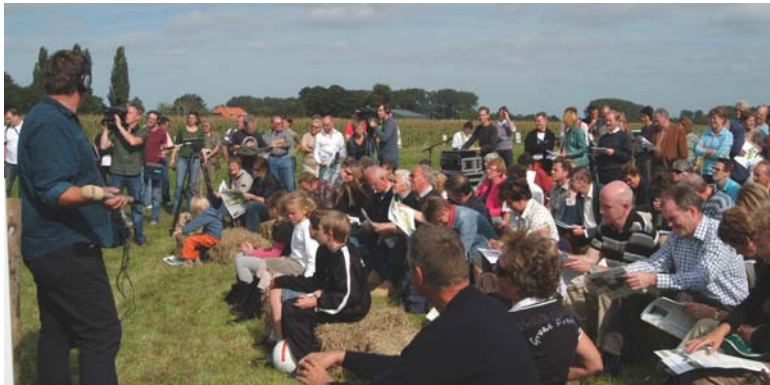
...hooibalen voor de bezoekers...