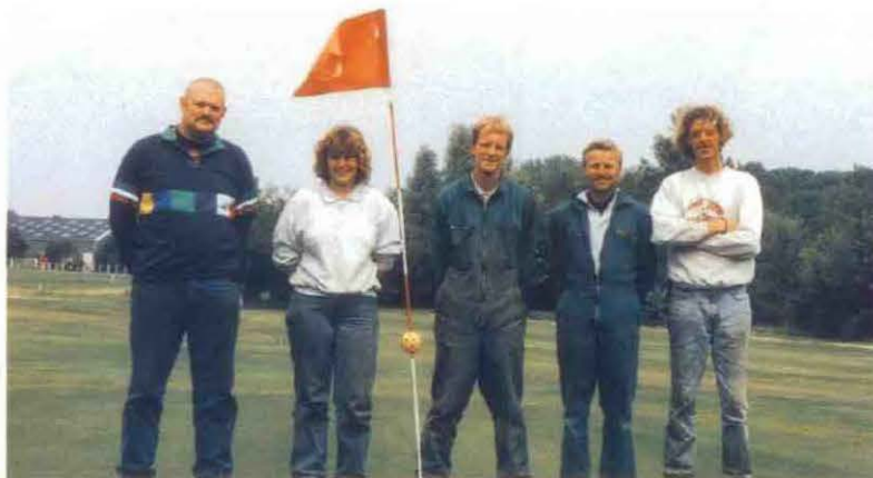
Het team van Zeegersloot