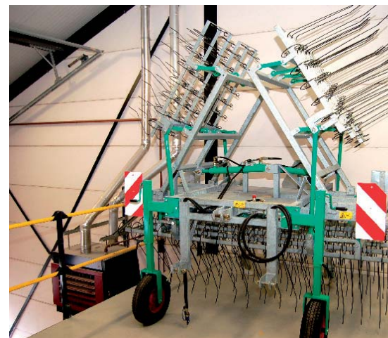
Producten van de zelfbouwafdeling met van links naar rechts