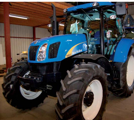
New Holland: gerenommeerd trekkermerk

Ongeveer 60 procent van de omzet wordt binnen de Bollenstreek gerealiseerd, maar het omzetaandeel buiten de streek is groeiende: in het Noordelijk Zandgebied, Groningen, Friesland, maar ook ver buiten de landsgrenzen. “We hebben wereldwijd klanten zitten, in Chili, Australië, Amerika. Lang leve het internet, dat speelt daar een grote rol in”. Vooral occasions