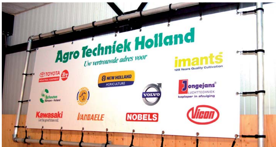
ATH voert een groot aantal dealerschappen

Eind jaren tachtig stond ATH aan de wieg van de ondergrasplanter. In de professionele bollenteelt heeft deze techniek het niet gehaald, maar in de (openbaar) groensector wordt met kleinere machines het onder gras planten tegenwoordig weer toegepast. Catsman acht de