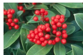
Skimmia japonica 'Temptation'

Deze rassen van PPO hebben Europees kwekersrecht en/of Plant Patent in de USA, of het is aangevraagd.