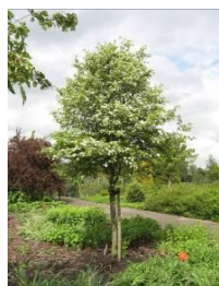
Crataegus succulenta 'Jubilee' BOOMFEESTDAG