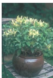
Lonicera 'Honey Baby'