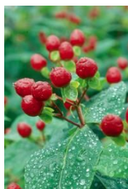
Hypericum x inodorum 'Arcadia'