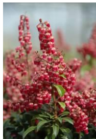
Pieris japonica 'Passion'