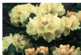
Rhododendron 'Centennial Gold' en R. 'Millennium Gold'