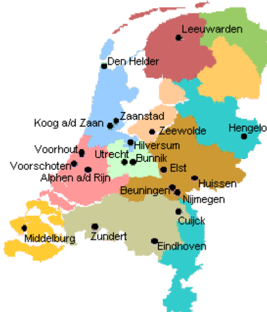
Figuur 1: Locaties van de proefbeplantingen