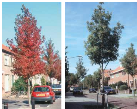
Figuur 2: Voorbeelden van proefbeplantingen

Trefwoorden: Laanbomen, gebruikswaarde, straatbomen