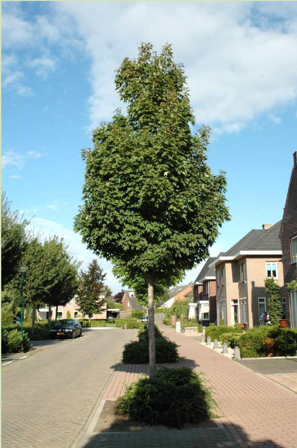
Cuijk, Korte Spruit; zomer 2008, 4 jaar na het planten.