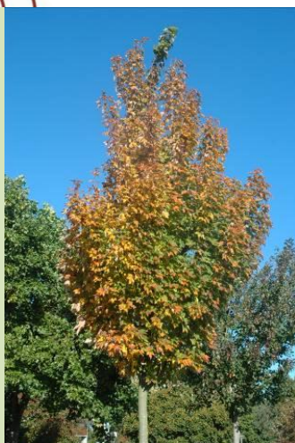
Herfstbeeld jonge boom