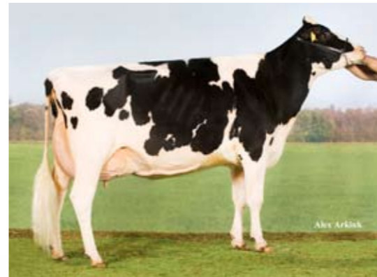
Veenhuizer D. Winnie (v. Damion), algemeen kamp. Prod.: 2.11 475 15.350 4,11 3,77 lw 101