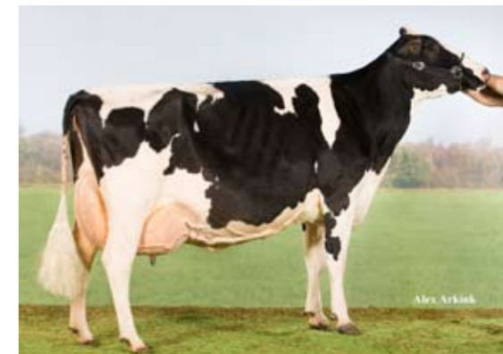
SD Janice (v. James), reservekampioene oud Prod.: 6.01 305 11.990 4,63 3,66 lw 147

ring. Winnie , die stamt uit de familie van To-Mar Blackstar , had zich doorontwikkeld tot een stijlvolle showkoe met een fraaie schouderpartij en welving boven in de ribben. Imponerend was ook de zeer lange en vast aangehechte vooruier en de hoge achteruier. Het leverde haar de welverdiende titel op.