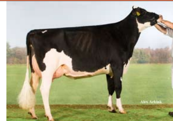
New Moore Esmeralda 38 (v. OMan), res. kamp. vaarzen Prod.: 2.05 68 2100 4,25 3,33 lw 113 l.l.