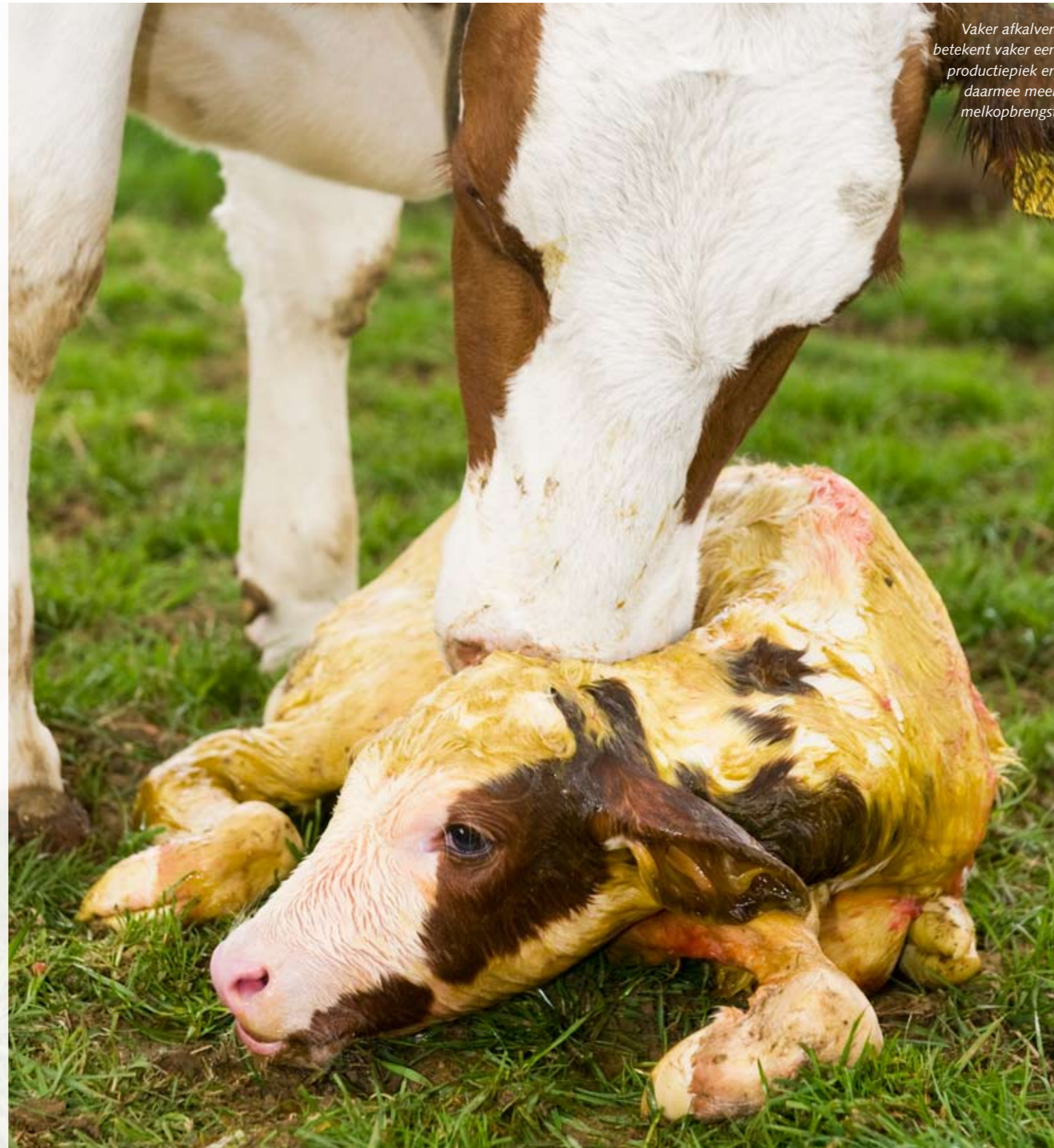
Vaker afkalven betekent vaker een productiepiek en daarmee meer melkopbrengst

‘We hebben in het rekenmodel zo veel mogelijk bekende data ingevoerd over vruchtbaarheid, dier-