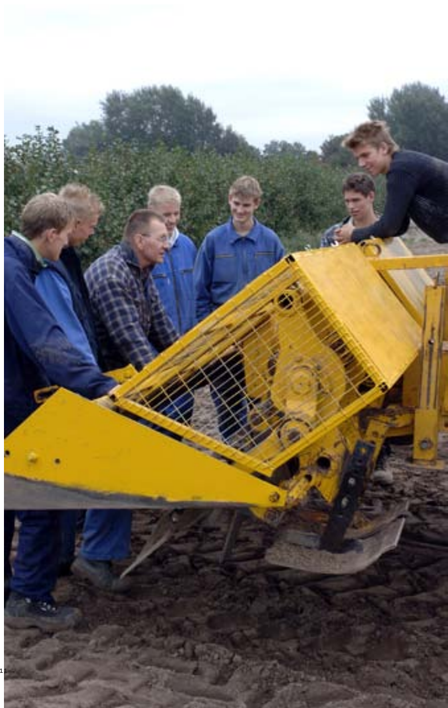
Akkerbouw- onderwijs in de polder

Steeds minder leerlingen kiezen voor akkerbouwonderwijs waardoor kwaliteitsverlies van deze opleidingen dreigt. Concentratie en vernieuwing van de leerweg moeten het tij keren, aldus een advies. Drie aoc-locaties willen het voortouw nemen. Als de overige aoc's en het hbo meewerken, gaat het lukken.