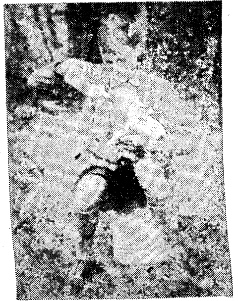
Wat zal hij worden?

De grootste mogelijkheden zijn er ongetwijfeld in de industrie. Als men het aantal mensen, dat hierin in 1949 werkte op 100 stelt dan was dit in de 5 jaar tot 1954 gestegen tot 114 dus met een zevende, terwijl het hele Nederlandse volk in deze periode slechts is gegroeid tot 107. Niet alleen is er plaats als gewoon arbeider, maar ook als fabrieksbaas of af-