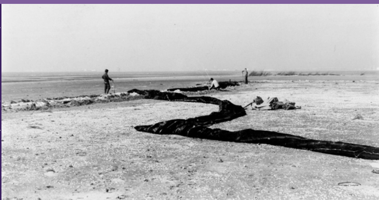
Vrijwilligers leggen een ring zandzakken aan op de Bol om het wegspoelen van sternnesten te voorkomen. Dankzij de inzet van vrijwilligers groeide hier in tien jaar tijd de kolonie dwergsterns uit tot de grootste van Noordwest-Europa.