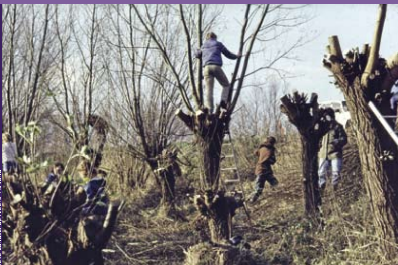
Jeugdige knotters aan het werk in Uithoorn.