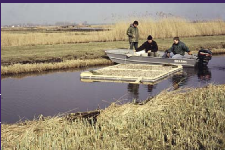
Rietlandbeheer en nestvloten voor sterns.