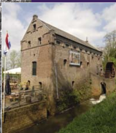
Vrijwilligers houden zich ook bezig met herstel van cultuurhistorisch erfgoed. De sloop van de Wijmarsche Watermolen te Arcen werd dankzij vrijwilligers tegengehouden. Zij hielpen ook bij de restauratie. Nu is in de molen een graanbranderij gevestigd.