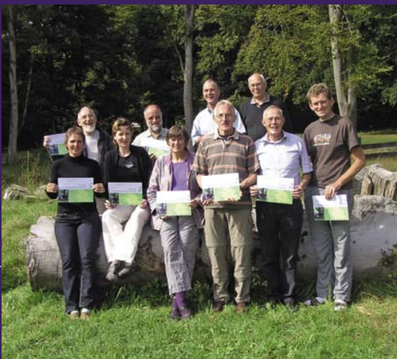
It Fryske Gea leidt vrijwilligers op tot excursieleiders: op de foto de excursieleiders die in het jaar 2007 hun opleiding succesvol af hebben gerond.