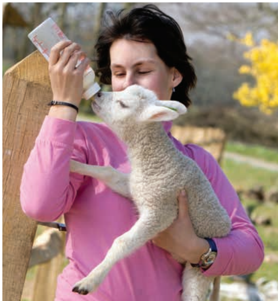
Onverwachte problemen op de multifunctionele boerderij: files op de dag dat iedereen tegelijk de lammetjes komt bewonderen.

Eind dit jaar zullen alle typen bedrijven op deze manier onder de loep zijn genomen. Daarna wordt met vertegenwoordigers uit de sector gekeken of de ontwikkelde strategieën herkenbaar en realistisch zijn. 'Om te voorkomen dat we straks horen: dat is een academisch verhaal, daar kunnen we niks mee.'