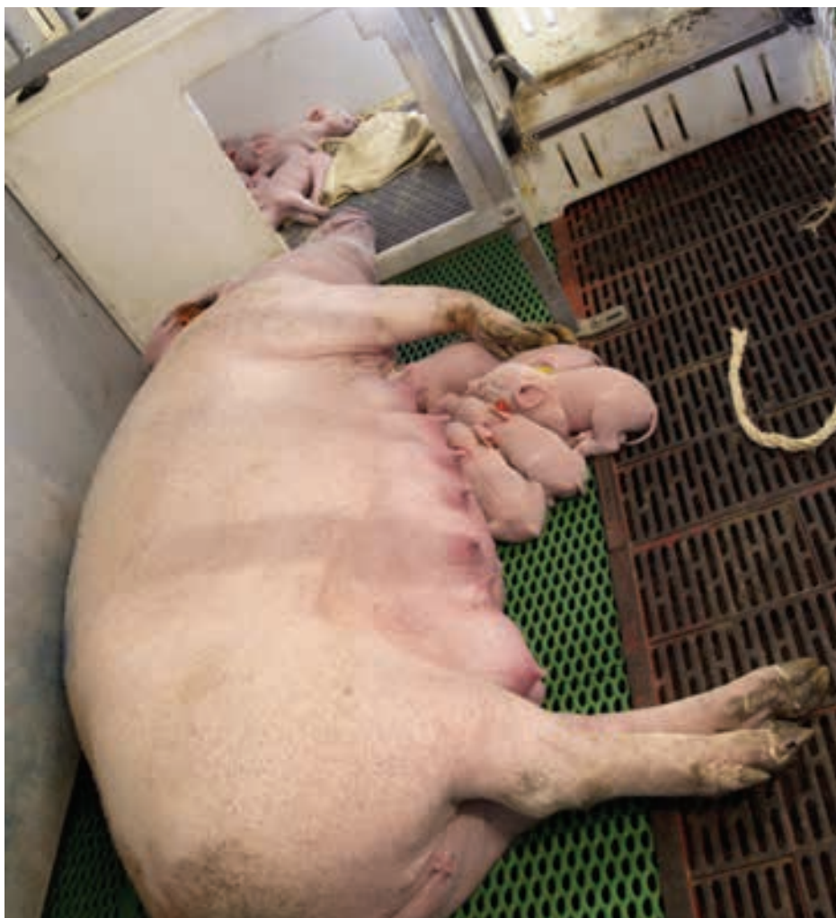
Een luxe kraamhok voor zeugen.

Naast naar welzijn en techniek, worden ook de kosten en baten van de nieuwe Pro Dromi-hokken en inrichting onderzocht. Kan bijvoorbeeld de jutezak uit, of leveren gelukkiger zeugen uiteindelijk meer op. Dat rendement is belangrijk, maar, zegt Hoofs: 'Arbeids-