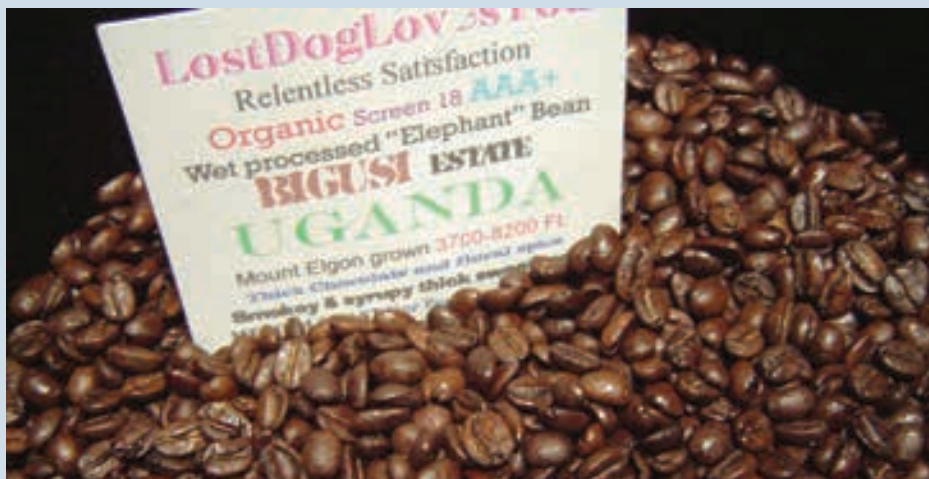
Het LEI bekijkt de biologische koffieketen in Uganda.

Volgens nieuwe Europese regels voor biologische landbouw en handel moeten inspecties gebaseerd op risicoanalyses de belangrijkste risico's beperken. Hoe je die risico's bepaalt is echter niet vastgelegd. Een model van het LEI kan uitkomst bieden.