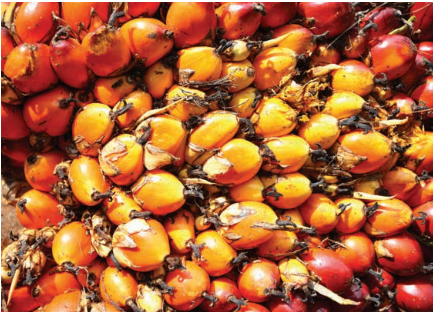
Vruchten van de oliepalm. 'Palmolie zit in 50 duizend producten, het is handig om samen normgetallen vast te stellen.'

TSC gaat verder een baseline vaststellen voor veelgebruikte producten. Zo moet er bijvoorbeeld een lijstje getallen komen met daarin de gemiddelde milieubelasting die de productie van een kilo wasmiddel oplevert; hoeveel water, hoeveel energie en andere kengetallen. Daarnaast gaat TSC overzichten maken van de voetafdruk van veelgebruikte ingrediënten. Die zijn handig bij het berekenen van de voetafdruk van samengestelde producten, legt Boone uit. 'Palmolie zit in 50 duizend producten. Het is handig om samen normgetallen vast te stellen in plaats van voor ieder product opnieuw.'