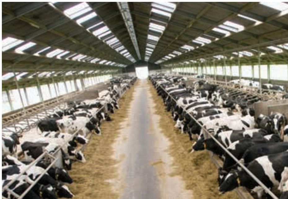
Een stal met meer dan 250 koeien is volgens de definitie mega.

Uit verschillende tellingen van het aantal megastallen in Nederland, kwamen afgelopen jaar andere aantallen. Dat kwam omdat de methoden verschilden. Maar het maakt discussie over beleid rond megastallen lastig. Daarom werd de helpdesk gevraagd om een totaaloverzicht op basis van de Nederlandse grootte-eenheid (nge).