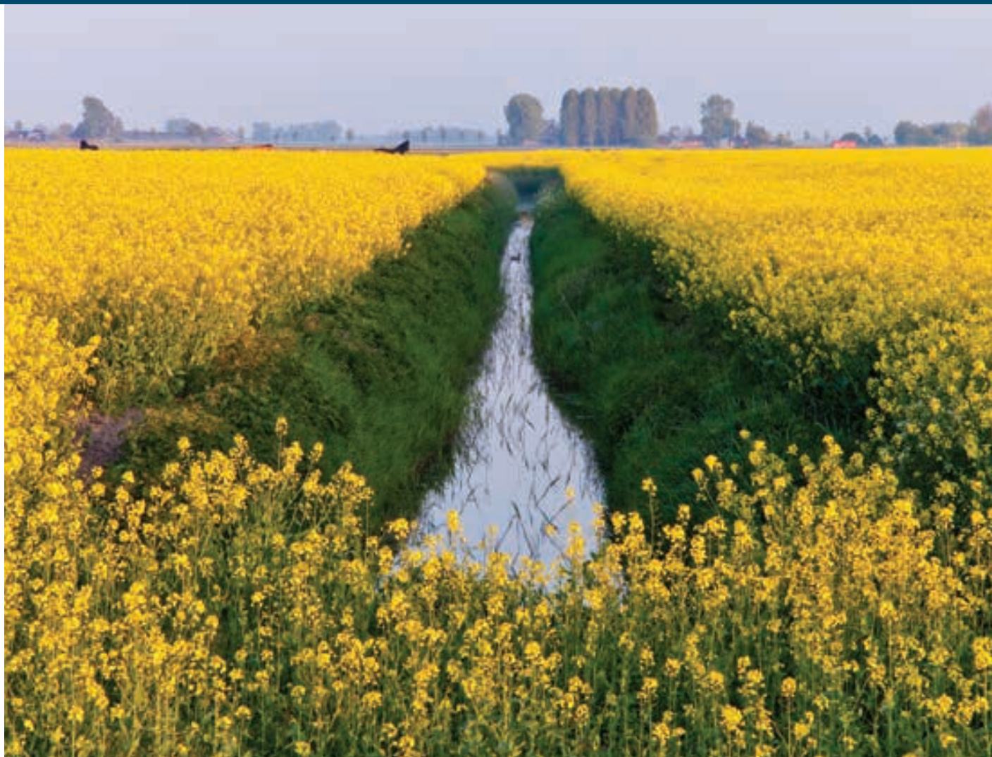
Het raapschroot van koolzaad kan met bioraffinage beter geschikt gemaakt worden voor veevoer.