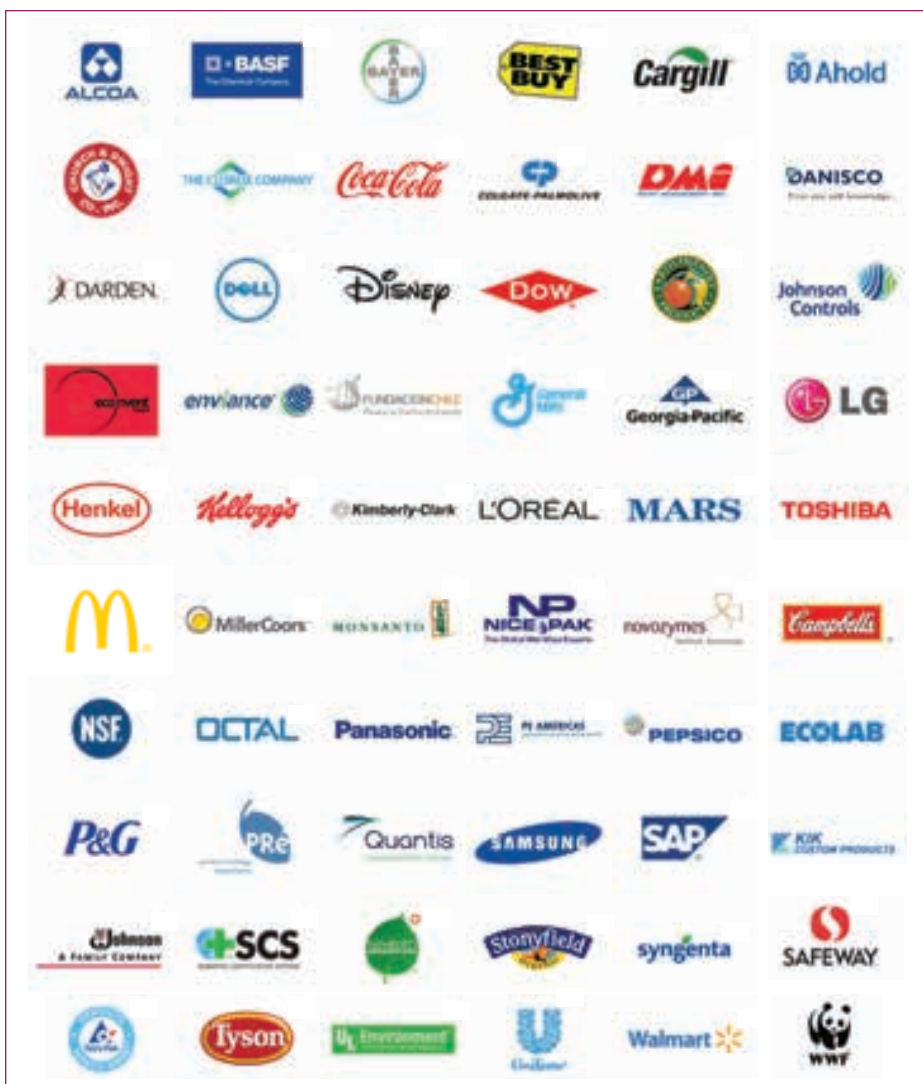
Leden van The Sustainability Consortium.

Ahold gaat de gegevens die uit de onderzoeken van TSC komen niet gebruiken voor nieuwe logo's en keurmerken die aangeven hoe groot de voetafdruk is van producten. Bolhuis. 'Wij geloven niet in specifieke labels voor bijvoorbeeld de CO 2 -voetafdruk.' Een klein deel van de consumenten zoekt specifiek zo'n label. De grote meerderheid vindt die waarden wel belangrijk, maar niet zodanig dat ze zich daar bij hun aankopen daar door laten leiden. 'Wij vinden dat klanten er vanuit moeten kunnen gaan dat de producten in onze supermarkten op een goede manier zijn geproduceerd, met aandacht voor mens en milieu. Wat er uiteindelijk in het schap komt en wat niet, hangt van verschillende zaken af zoals duurzaamheid, commerciële overwegingen,