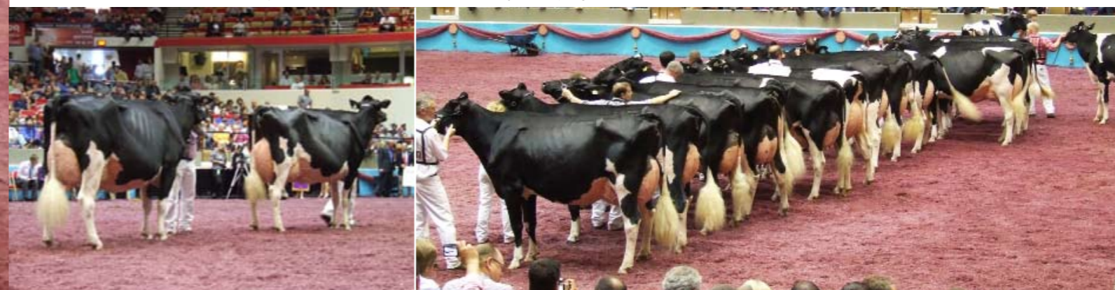
De latere kampioene jonge koeien Camomile (v. Damion) voert haar rubriek aan