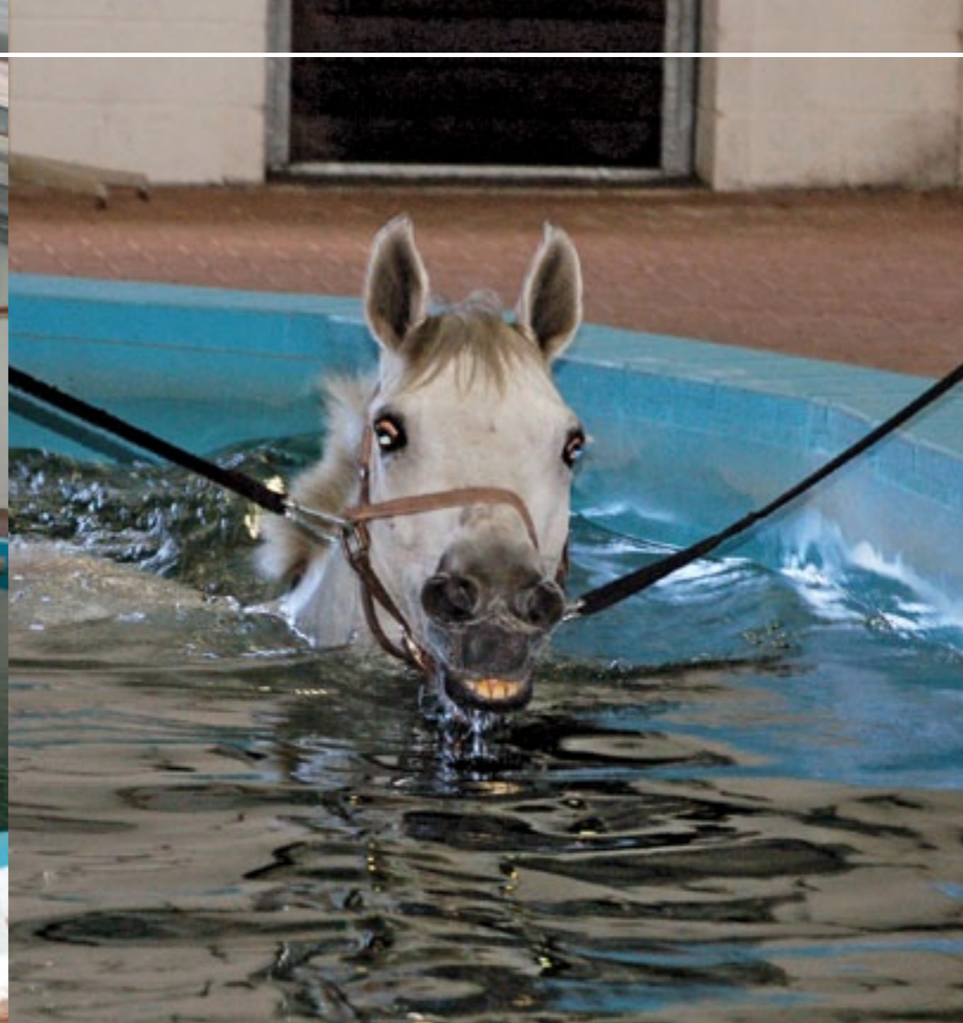
Rustig zwemt dit paard twee baantjes in het bad.