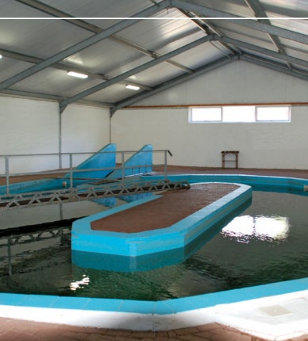
Het grote paardenzwembad van 2,5 meter diep staat klaar voor gebruik.