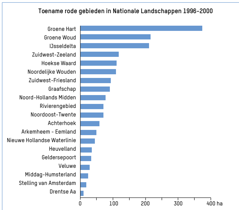
Figuur 1. De cijfers over de toename van bebouwing en infrastructuur in Nationale Landschappen laten nog niet zien wat dat betekent voor het landschap.