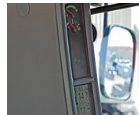
▲ De cabine stijl met digitale en analoge klokken. De touchscreen geeft meer informatie.