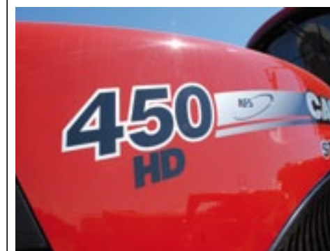
▲ De Case IH Steiger 450 HD heeft een zwaarder frame dan de standaard 450.