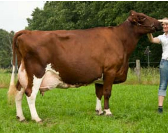
Nora 65 (v. Sputnik), kampioene koeien roodbont Productie: 6.06 345 9451 4,82 3,53 1.1.