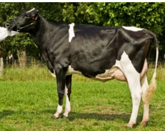
Iltanne (v. Goldwyn), kampioene vaarzen zwartbont Productie: 2.00 184 4923 3,75 3,01 1.1.