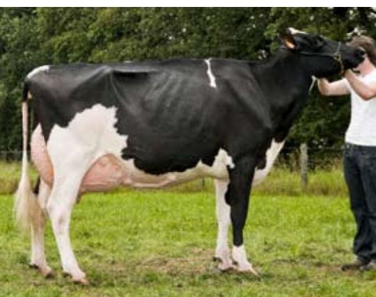
8376 de Blier (v. Goldwyn), kampioene koeien zwartbont Productie: 5.00 156 8260 3,58 2,98 1.1.