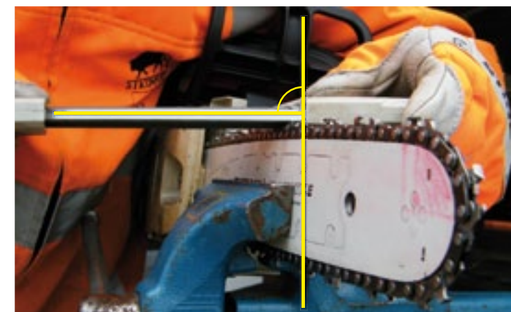
1 Haaks, 90°, op de GELEIDER De bedoeling is dat u de combivijlhouder zo vasthoudt dat de geleiderstaven vlak (horizontaal) over het dak van de beitel geleiden. Eenvoudig gezegd, u houdt de combivijlhouder haaks, 90°, op de geleider.