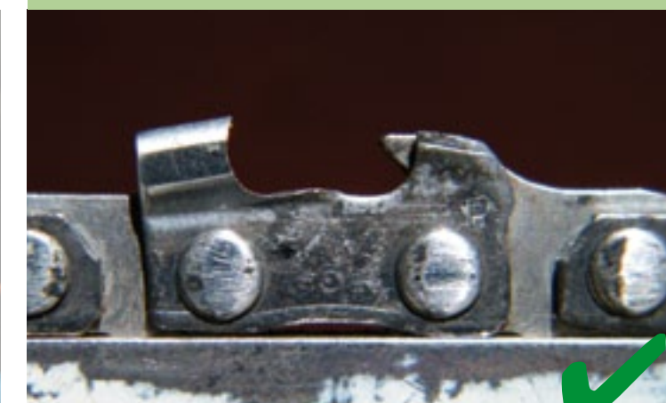
6 Juiste hoogte en vorm dieptesteller De hoogte van de dieptesteller is hetzelfde gebleven. Nu is ook de vorm, de schuinite van de dieptesteller goed. Minder kans op kickback.