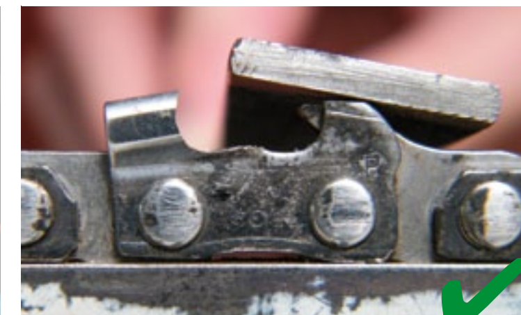
5 Dieptesteller schuin, onder 10° vijlen Om de kans op kickback te verminderen, zijn bij Stihl kettingen de dieptestellers schuin van vorm. Met een zoet vijltje kunt u de 'bult' op de dieptesteller onder 10° wegvijlen.