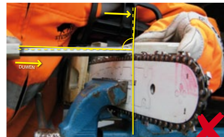
2 Speling geleider-ketting Bij het vijlen drukt u de ketting een klein beetje opzij en dus komt de beitel een klein beetje scheef te staan. De vijlhouder gaat nu niet meer vlak over het dak van de beitel. Hierdoor komt de vijl hoger bij de punt van de beitel en wordt de punt weggevijld.