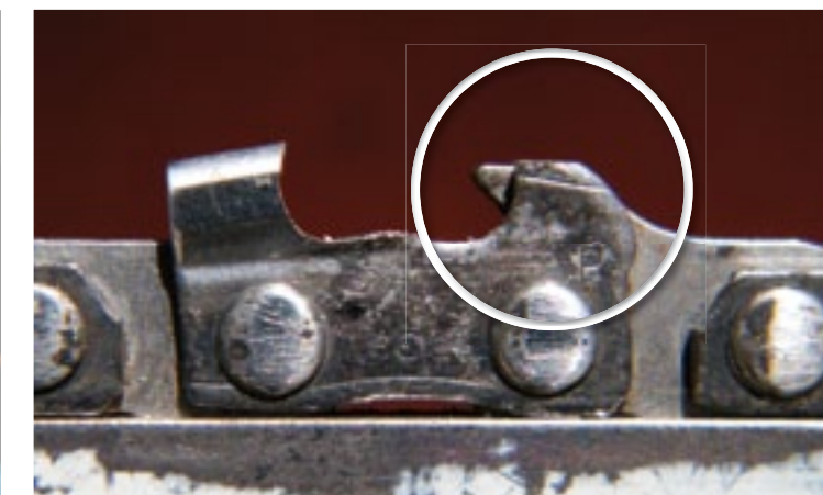
4 Dieptesteller op de juiste hoogte Na het vijlen met de combivijl is ook de dieptesteller op de juiste hoogte. De markeerlijn geeft echter aan dat de vorm van de dieptesteller schuin dient te zijn.