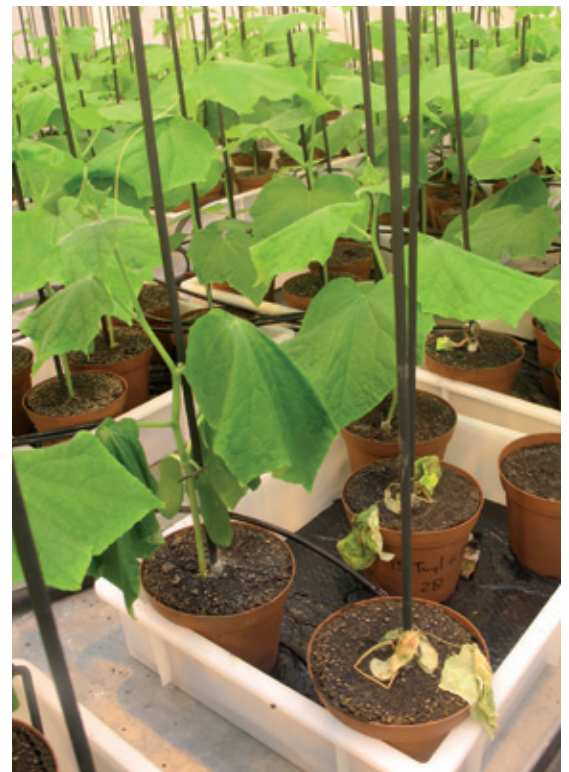
Biotoets voor het bepalen van weerbaarheid van steenwolmatten tegen Pythium in komkommer (links). Alleen de eerste plant wordt besmet. De snelheid waarmee de andere drie komkommerplantjes Pythium-symptomen laten zien is een maat voor substraatweerbaarheid. Bij de bodemweerbaarheidstoets (rechts) wordt elke pot besmet.