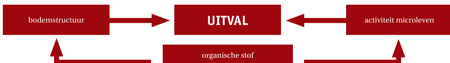
Figuur 3. Eenvoudig overzicht van het Bodemweerbaarheidsmodel met enkele parameters en hun samenhang.