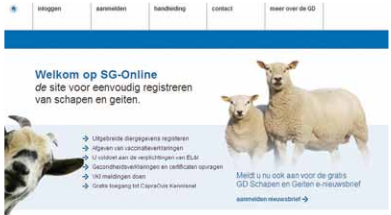
Figuur 1. De nieuwe startpagina van SG-Online

te registreren. Hiermee is de informatie beschikbaar voor onder andere berekening van fokwaardes bij stamboeken, deelname aan gezondheidsprogramma's bij de GD én u voldoet aan de verplichtingen van EL&I.