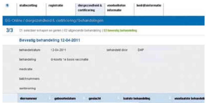
Figuur 3. Vastleggen van een Q-koorts-basisvaccinatie.

te registreren. Hiermee is de informatie beschikbaar voor onder andere berekening van fokwaardes bij stamboeken, deelname aan gezondheidsprogramma's bij de GD én u voldoet aan de verplichtingen van EL&I.