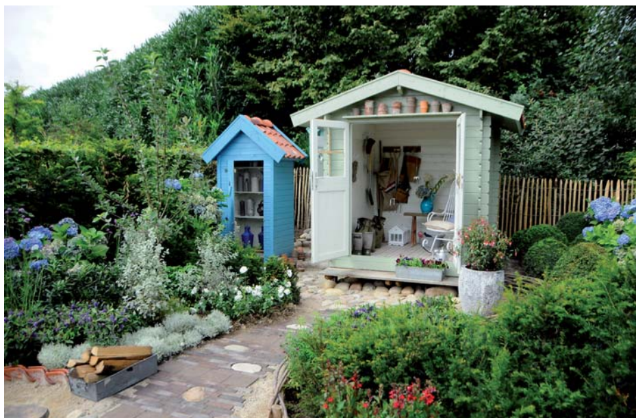
Een verwilderd en boers effect, mede dankzij de blauwe en rode kleuren in de beplanting