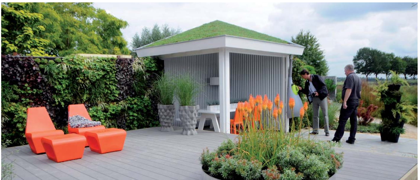
De verticale beplanting zorgt voor een groene omgeving in de stijltuin 'Gebiologeerd'

stijltuinen gebeurt in nauwe samenwerking met de Tuinen van Appeltern, een enorme klus. De STN onderscheidt zes verschillende tuintypes die de tuin ieder op hun eigen manier beleven. De stijltuinen die jaarlijks worden aangelegd worden ontworpen voor de drie meest relevante groepen consumenten. “Dit zijn het gele type (de sociale buitengieter), het blauwe type met een eigen stijl en het blauwgroene type (de trotse tuinbezitter)”, vertelt Horstra. Tezamen vormen zij 58 procent van de Neder-