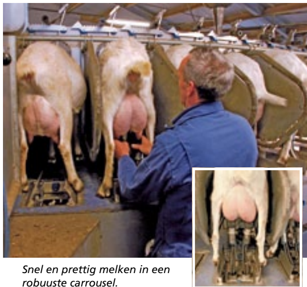
Snel en prettig melken in een robuuste carrousel.

Dairymaster verwacht dat de buitenmelker een levensduur haalt van 30 jaar. Mede omdat het onderstel van de carrousel is gebaseerd op de koeienbuitenmelker van de fabrikant. "Hij is niet alleen extreem robuust maar heeft ook heel weinig onderhoud nodig", aldus Schut. Dat onderhoud houdt in: een driemaandelijke smering en een jaarlijkse onderhoudsbeurt. Een 90-stands buitenmelker in de getoonde roestvaststalen versie is verkrijgbaar voor plus-minus 200.000 euro.