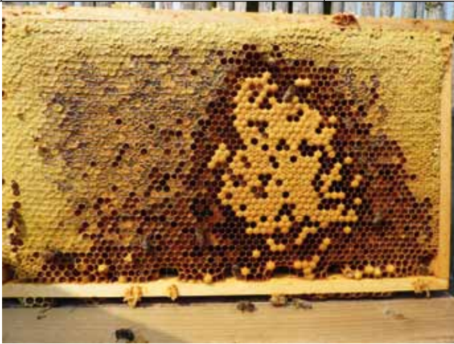
Met een aantal ramen met zoveel voer kan het bijenvolk zich goed voorbereiden op de overschakeling van zomerbijen naar winterbijen