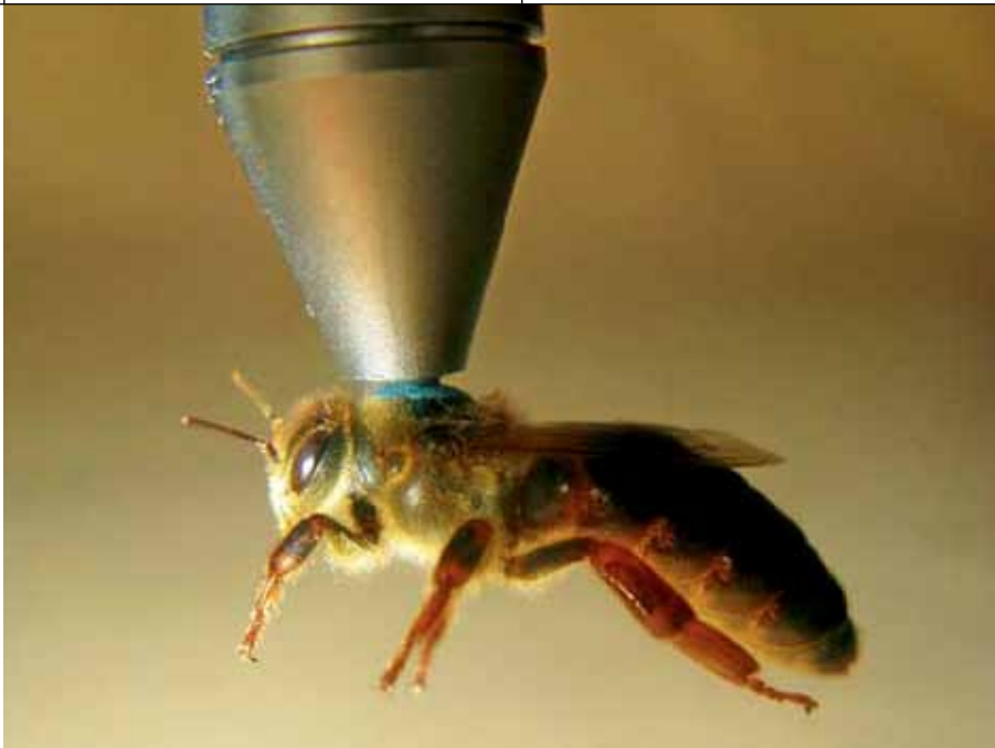
Koningin opgetild met de magnetische pen

voor je uit loopt wanneer je aan de zijkant van de broedbak begint en dan vind je haar op het laatste raam. Maar wees erg voorzichtig met het omhoog halen van de ramen uit het midden. Schuif eerst de belendende ramen iets opzij. Het risico de moer te pletten bij deze actie is zeker niet denkbeeldig. • De eerste ramen die je onderzoekt, zet je na inspectie in een apart bakje zodat je makkelijker in de bak kunt kijken naar het volgende raam en de moer niet terug kan lopen naar een al onderzocht raam.