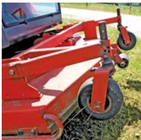
De maaierhoogte is instelbaar op zeventien maaierhoogtes. Deze stel je zowel bij de voor- als achterwielen in. De scalpeerwielen hoeft je nauwelijks te verzetten.

twee achteraan). Optioneel is een mulchset leverbaar. De drie messen zijn in een V-vorm opgesteld. Afhankelijk van het type dek, zijn er geleideplaten, die het gras naar achteren of opzij sturen, onderaan het dek gelast. Deze hebben een halfronde vorm. Dit is een goed begin voor de constructie van de mulchset.